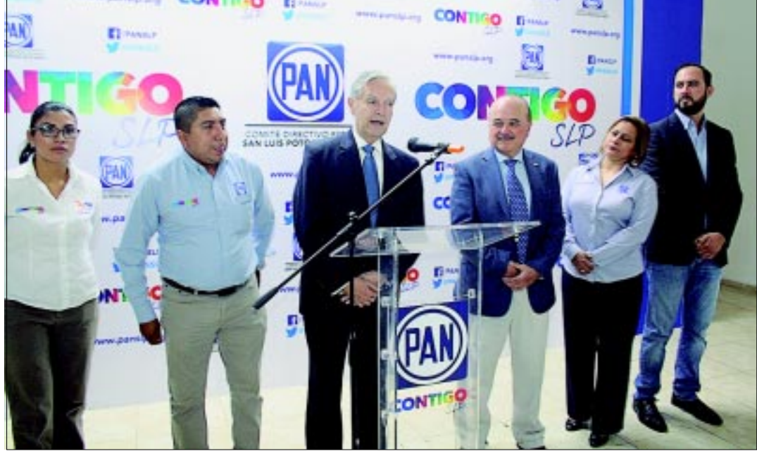
Luis Ernesto Derbez y Ernesto Ruffo Appel, realizaron diversas actividades en su visita a San Luis Potosí.

Redacción El ex canciller mexicano, Luis Ernesto Derbez Bautista, y Ernesto Ruffo Appel, Senador de la República y ex gobernador de Baja California, expresaron ayer dudas sobre el supuesto enriquecimiento del líder nacional del PAN, Ricardo Anaya Cortés, luego de que una investigación periodística revelara que en los últimos 14 años y de la mano de Acción Nacional, tuviera un crecimiento de mil 304% tan sólo en propiedades. Durante una reunión con directores de medios de comunicación, ambos aspirantes a la Presidencia de la República por el PAN, coincidieron en señalar que lo anterior es producto de la aprobación por unanimidad de un resolutive de la Comisión Permanente Nacional en el que se rechaza el pase automático del actual Procurador General de la República para convertirse en Fiscal General de la Nación para los próximos 9 años.