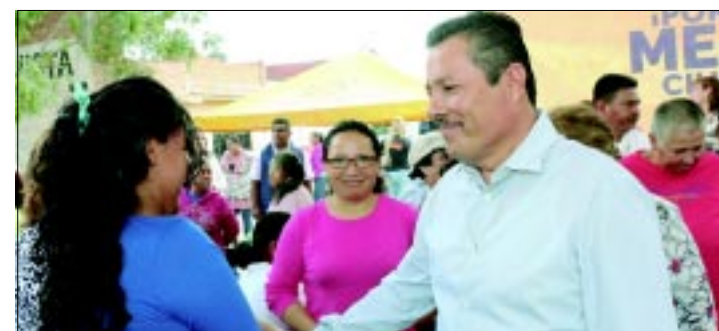
El Alcalde, Ricardo Gallardo Juárez, destaca a nivel nacional por sueldos austeros, según un estudio del Portal Nación321

Por lo que a su llegada a la Alcaldía, Gallardo puso en marcha un programa de austeridad para enfrentar el adverso escenario de las finanzas municipales, y se redujo el sueldo en dos ocasiones