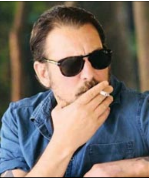
Ray Loriga apuesta por una ciudad transparente en 'Rendición'