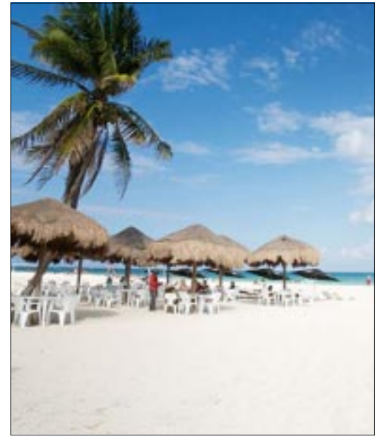
Conoce los 7 mejores destinos para vacacionar México