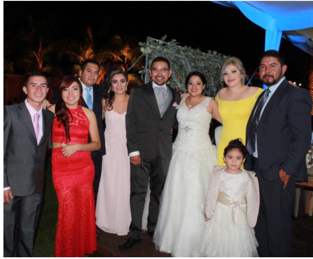
El enlace fue muy alegre.