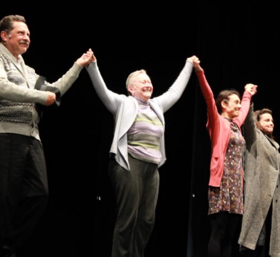
Los actores de la obra agradecieron al público sus aplausos.