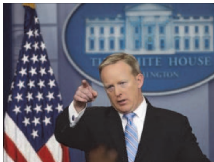
WASHINGTON. -Unas horas antes, el propio Trump hizo una acusación similar desde la red social Twitter.

ves opinó en Twitter que los ciberataques rusos son una «farsa impulsada por los demócratas». Pero el portavoz de la Casa Blanca, Sean Spicer, aseguró hoy que Trump cree que «Rusia probablemente» estuvo detrás de los ciberataques que afectaron la campaña electoral, aunque «posiblemente también otros países» son responsables de ello. Preguntado sobre qué está haciendo Trump para responder a esa injerencia rusa, Spicer no quiso entrar en detalles, pero aseguró que ha «dado pasos» para garantizar la «seguridad cibernética» en Estados Unidos.