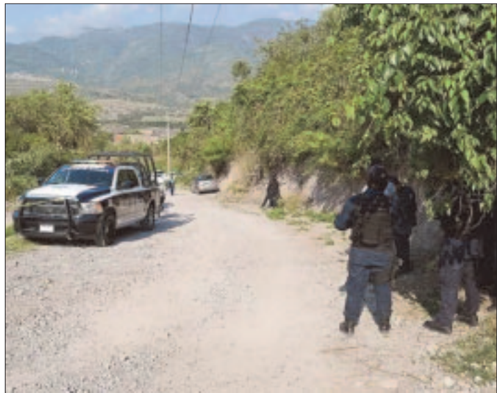
CIUDAD DE MEXICO. - Los delitos del fuero común aumentaron de 716 mil 37 casos en 2012 a 732 mil 255 reportes en 2017, de acuerdo con cifras oficiales.

entregado a las entidades federativas a lo largo de los años, las estadísticas muestran que en los ejercicios presupuestales 2013, 2014, 2015 y 2016 la Zona Metropolitana de Monterrey recibió el monto más cuantioso para la prevención del delito, al sumar 469 millones 712 mil 323.88 pesos; y le sigue el municipio de Acapulco, Guerrero, con 367 millones 943 mil 728.12 pesos.