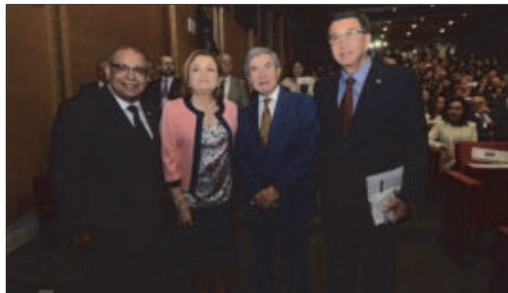
CIUDAD DE MEXICO. - Los titulares de la Función Pública y la Auditoría Superior de la Federación hicieron llamados al Congreso y a los Estados.

El presidente de la Comisión Anticorrupción y Participación Ciudadana del Senado de la República, Héctor Yunes Landa, informó que sólo 28 Congresos locales han aprobado la reforma constitucional en materia de combate a la corrupción.