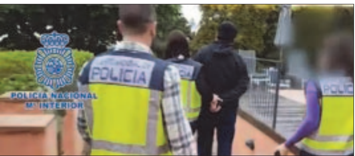
CIUDAD DE MEXICO. - Tras detenerlo en abril, la justicia española aprobó extraditar a México a Javier Nava, principal colaborador del detenido exgobernador de Veracruz, Javier Duarte.

Según las investigaciones realizadas por la Procuraduría General de la República (PGR), Moisés Mansur compró, entre el 22 de agosto y 28 de noviembre de 2011, terrenos ejidales en Campeche por un millón 650 mil pesos, aunque el precio real era de 200 mil pesos.