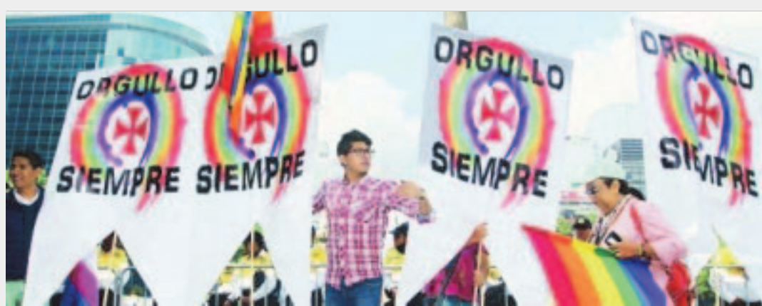
CIUDAD DE MEXICO. - El Alto Comisionado de la ONU para los Derechos Humanos pide prohibir la discriminación basada en la orientación y la identidad de género y salvaguardar su libertad de expresión.

están bien establecidos, desde la despenalización de las relaciones entre personas del mismo sexo hasta la aplicación de amplias medidas antidiscriminación. También es necesaria la educación para terminar con la homofobia de raíz", sostuvo Navi Pillay. Pillay, abogada de Sudáfrica, ex activista en contra de la política de apartheid y la primera mujer a acceder a la Corte Suprema de Sudáfrica en 1995, fue nombrada Alta Comisionada para los Derechos Humanos en 2008.