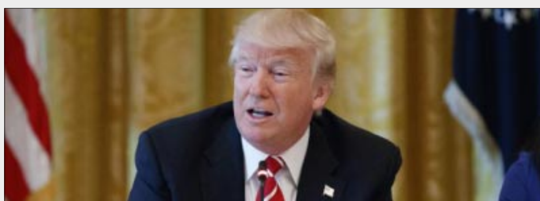
WASHINGTON.- «Amo a todas las personas, pero en esas posiciones no quiero a alguien pobre, ¿tiene sentido, no?», dijo hoy el magnate al intentar argumentar porque hay tantos millonarios y grandes empresarios en su gabinete.

‘porqué eliges a una persona rica para estar a cargo de la economía’. Y respondí: ‘porque es la clase de pensamiento que queremos’ dijo Trump durante su discurso en Iowa. «Ellos están representando al país, no quieren el dinero, tuvieron que renunciar a mucho para aceptar estos puestos. Es gente con grandes mentes empresariales y es por eso que los necesitamos, para que el mundo no se aproveche de nosotros», declaró el magnate.