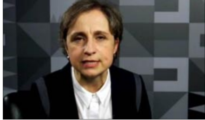
CIUDAD DE MÉXICO.- La periodista señala que Presidencia ha dado una «respuesta inaceptable» por sólo enviar una nota al editor de New York Times en la que negaba la participación del gobierno mexicano en el espionaje.

«Vamos a ver hasta dónde llegan las instancias del Gobierno mexicano, vamos a ver hasta dónde la propia sociedad mexicana exige a un gobierno que rinda cuentas y que explique por qué ha espionado a periodistas, a defensores de derechos humanos y a otras personas que empiezan a levantar la mano, y dicen: a mí también el gobierno me espía... estamos pues a la espera del Presidente Peña».