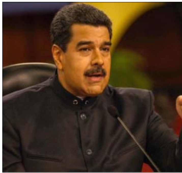
VENEZUELA.- El mandatario sudamericano dijo esto al asegurar que «el gobierno mexicano prohibió cualquier manifestación pública en apoyo a Venezuela» durante la Asamblea de la OEA, que se realizó en Cancún.

sentadas por la delegación venezolana -incluyendo una contra el gobierno mexicano por el caso Ayotzinapa. Sin embargo, la asamblea concluyó sin que el organismo lanzara una resolución conjunta sobre la crisis en el país sudamericano.