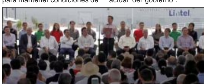
CIUDAD DE MÉXICO.- «Espero, al amparo de la ley, pueda aplicarse contra aquellos que han levantado estos falsos señalamientos contra el gobierno», advirtió el mandatario.

Tras inaugurar el Parque Industrial de Lagos de Moreno, el presidente Peña recalcó que el uso de inteligencia que tiene el gobierno, y que utilizan diversas dependencias, es para mantener condiciones de