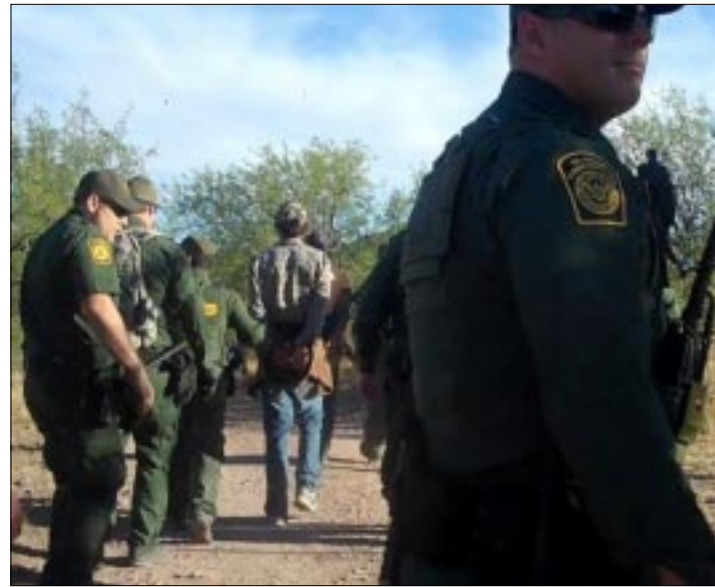
NUEVA YORK.-La mayoría de los casos están radicados en cortes de los estados de California, 37 mil 787; Texas, 26 mil 814 e Illinois, 10 mil 658.

tualmente en espera de una decisión de parte de un tribunal migratorio en Estados Unidos, aunque seguidos de cerca por ciudadanos de El Salvador (130 mil 537). Tras casos de mexicanos y salvadoreños, las cortes de migración en Estados Unidos acumulan 98 mil 563 casos de ciudadanos de Guatemala; 84 mil 954 de Honduras y 22 mil 779 de China. Los 598 mil 943 casos que desahogaban hasta el 31 de mayo las cortes de migración en Estados Unidos representan un notable aumento de 100 mil casos respecto de mayo de 2016, cuando se acumulaban 492 mil 978. La espera promedio general de la resolución de los casos es de 670 días.