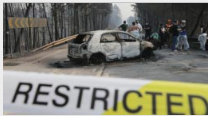
PORTUGAL.-Según últimos datos oficiales asciende a 62 muertos y 57 heridos, sin embargo, las autoridades se encuentran preocupadas por los vientos cruzados que dificultan el control y extinción del fuego.

Las tareas avanzan con los medios terrestres, que suman más de 680 efectivos llegados de Setúbal, Coimbra y Lisboa. Fuentes de la Policía Judicial (PJ) dijeron a Efe que el impacto de un rayo en un árbol seco es la causa más probable de este incendio, el más grave de los últimos años en Portugal.