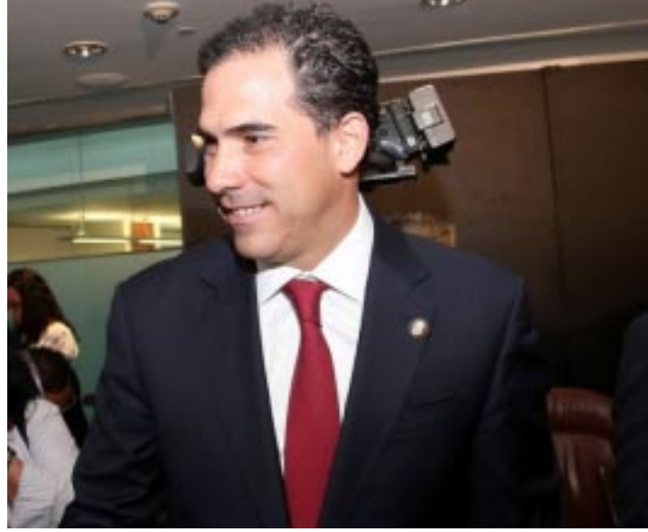
CIUDAD DE MEXICO.-Asegurar que sólo se requiere una modificación constitucional es erróneo, precisó el presidente de la Mesa Directiva del Senado.

Finalmente, el presidente de la Cámara alta indicó que, respecto al sistema de impugnación, es imposible de acortar los tiempos ya que en la pasada elección se valoraron más de 10 mil objetos probatorios en 40 días y hacerlo en menos tiempo es prácticamente imposible, por lo que se pondrían en riesgo las garantías procesales y sustantivas para el proceso electoral 2017-2018