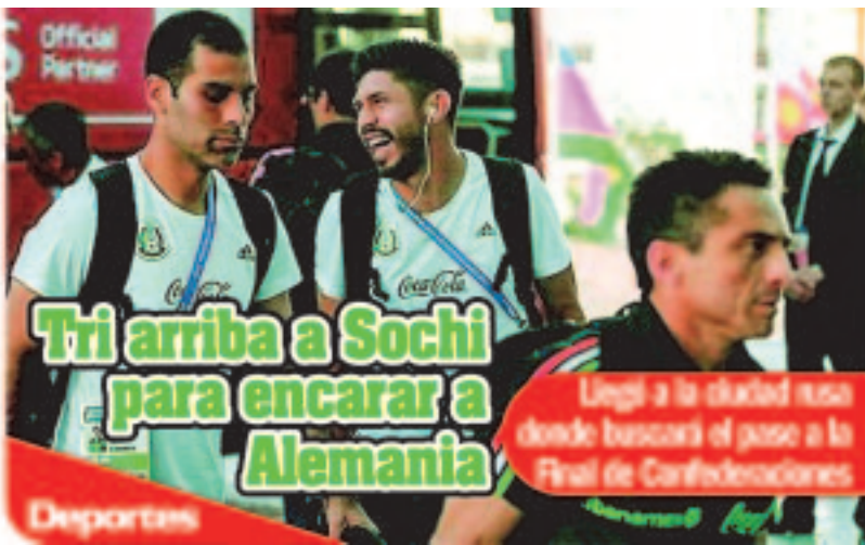
Tri arriba a Sochi para encarar a Alemania