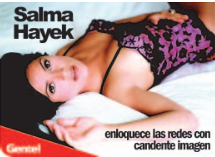
Salma Hayek enloquece las redes con candente imagen