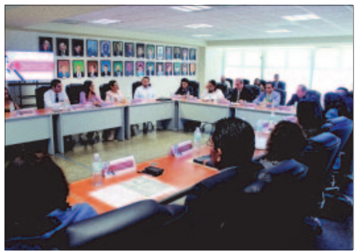
Acuerdan delinear entre todas las instituciones, acciones estratégicas para el fortalecimiento en la localización de personas.

nes y resultados obtenidos en las investigaciones ministeriales y en la búsqueda de las personas.