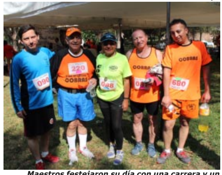
Maestros festejaron su día con una carrera y un desayuno.