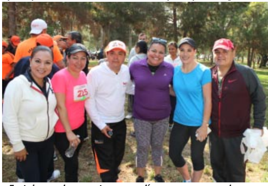
Festejaron a los maestros en su día en una carrera y desayuno.