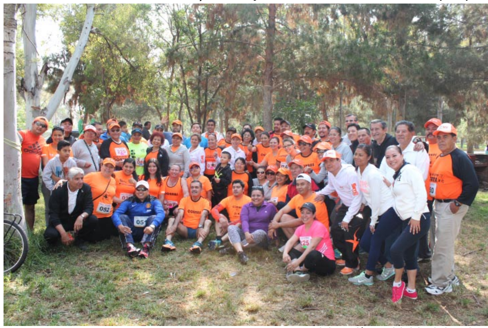
Los maestros de la Sección 52 y del Club Atletico Cobras.