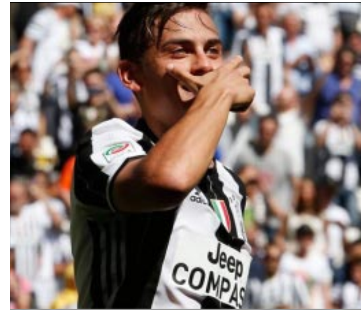
Chivas, Cruz Azul, Monterrey y Tigres se medirán a estas escuadras del 17 al 19 de julio en la Súper Copa Tecate

Así, Juventus y Porto tendrán una pretemporada muy a la mexicana y se espera que podamos ver figuras de la talla de Buffon, Dybala, Mandzukic, Higuaín e Iker Casillas. Además de los mexicanos Tecatito Corona, Héctor Herrera y Miguel Layúñ.