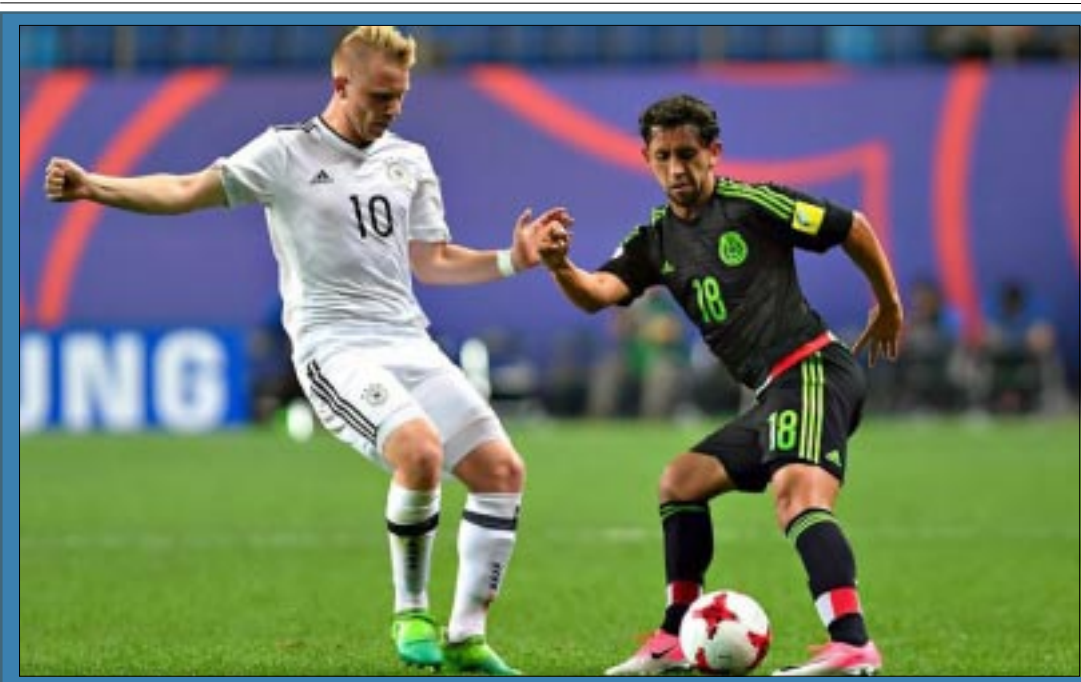
El Tri tiene un pie dentro de los Octavos, después de colocarse como segundo de grupo tras igualar 0-0

el cuerpo técnico, se decidió que Corona regrese a su club para continuar con su rehabilitación", informó el máximo organismo del fútbol en México. El combinado nacional tendrá un par de meses ajetreos. Entre mayo y junio disputará partidos amistosos y un par de duelos de eliminatoria mundialista contra Honduras y Estados Unidos. Además, entre junio y julio el Tri participará en la Copa Oro y la Copa Confederaciones.