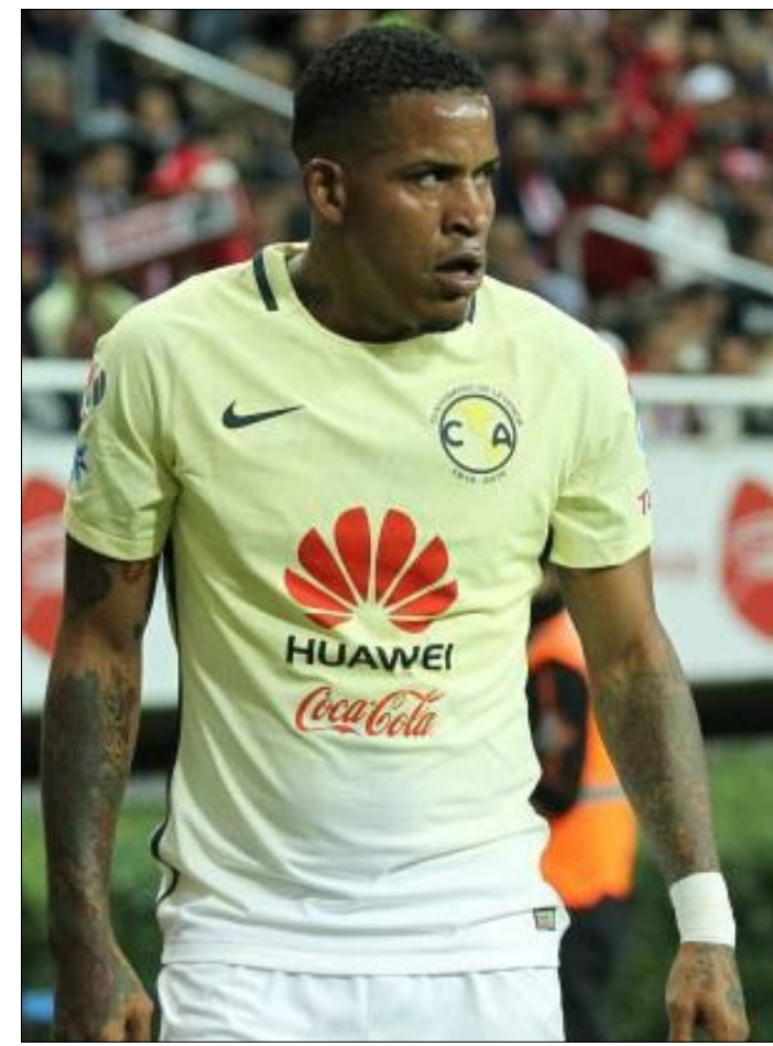
El delantero dedicó unas palabras a las Águilas a través de las historias de Instagram.

El jugador no renovará contrato con las Águilas y su futuro podría estar en Sudamérica para llegar a la Liga de Brasil. El delantero dedicó unas palabras a las Águilas a través de las historias de Instagram.