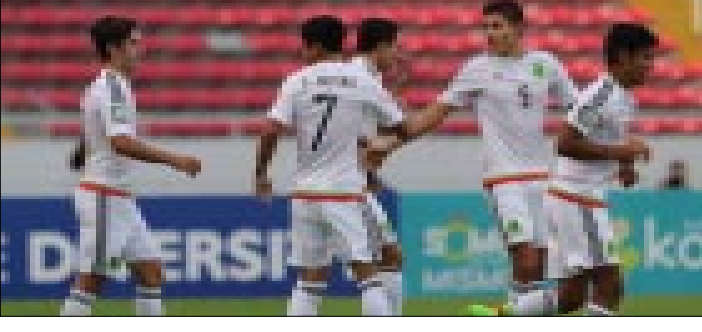
El Tri Sub-20 buscará mejorar la actuación de 1977.