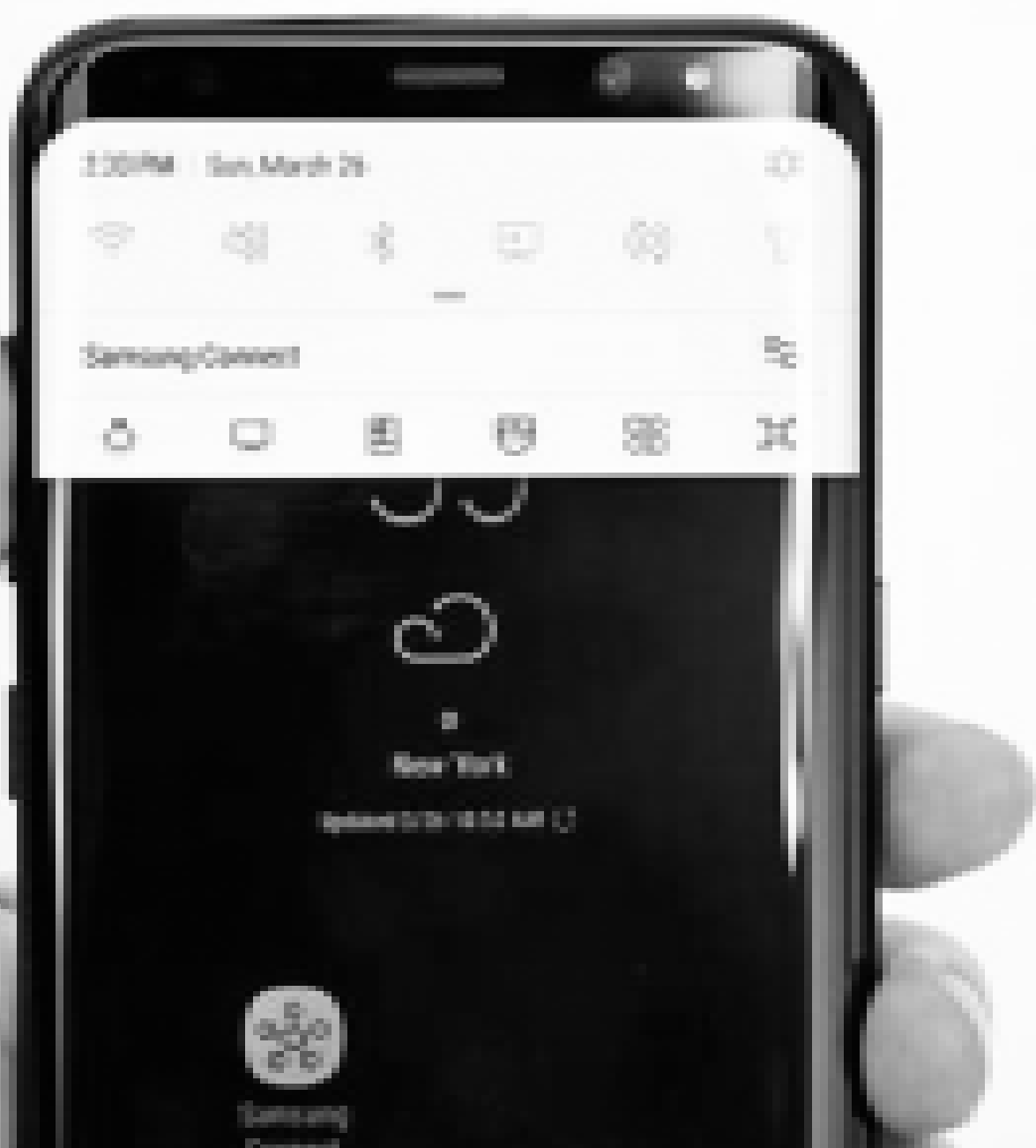
Los nuevos modelos de la serie del teléfono inteligente Galaxy S salieron a la venta el 21 de abril en Corea del Sur, Estados Unidos y Canadá.

Samsung confía en que el buen rendimiento del S8 le ayude a dejar atrás el ascenso del Galaxy Note 7, cuyas igniciones espontáneas le llevaron a una retirada sin precedentes del producto que le ocasionó un cuantioso impacto económico.