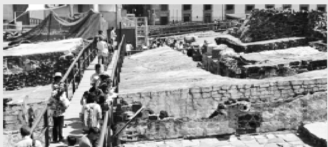
Uno de los últimos hallazgos es una ofrenda que contiene restos de fauna marina y un disco de oro.

Las excavaciones que el Proyecto Templo Mayor realiza actualmente en lo que fue el recinto sagrado de la antigua Tenochtitlán sigue dando sorpresas.