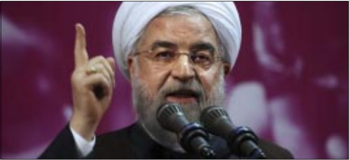
TEHERAN.-El presidente iraní y candidato a la reelección, Hasan Rohani, ganó los comicios presidenciales, al conseguir cerca del 57% de los votos.

Ahmadi afirmó que el proceso de recuento de los votos y los resultados están «claros», aunque no haya terminado por completo el escrutinio. De acuerdo con el Consejo Electoral, del total de 40 millones 76 mil 729 votos escrutados, 38 millones 914 mil 470 han sido validados como correctos, citó la agencia iraní de noticias IRNA.