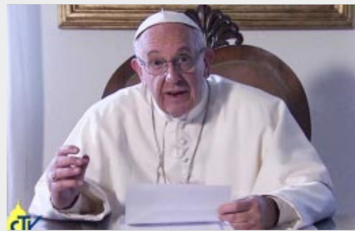
CIUDAD DEL VATICANO.-Francisco llama a afrontar la crisis con sentido de justicia entre las generaciones y de responsabilidad para el futuro.

Ante ello, afirmó que aplicar "este enfoque de la actividad económica, basado en la persona, alentará la iniciativa y la creatividad, el espíritu empresarial y a las comunidades de trabajo y de empresa, de modo que se pueda favorecer la inclusión social y el crecimiento de una cultura de solidaridad eficaz".