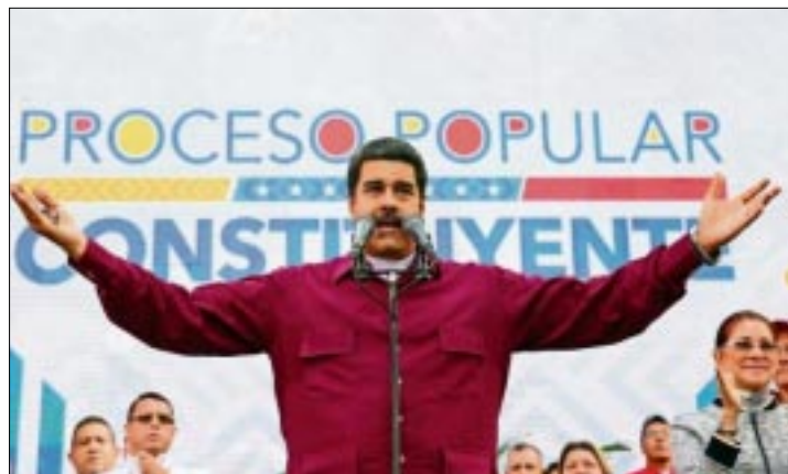
CARACAS.-El país está a merced de la violencia y el narcotráfico, asegura; acusa a Washington de financiar protestas en Venezuela.

Además, "humilla al presidente [de Colombia, Juan Manuel Santos] ayer en la rueda de prensa, deporta a miles de colombianos todas las semanas y no hay gobierno en Colombia que defienda la dignidad de su pueblo.