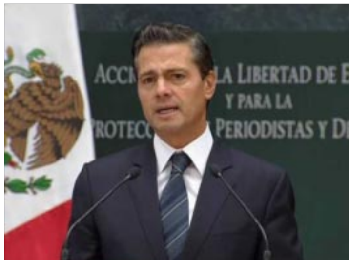
CIUDAD DE MEXICO.-El presidente Enrique Peña Nieto se comprometió a fortalecer la estructura y presupuesto para proteger a los defensores de los Derechos Humanos y periodistas, tras guardar un minuto de silencio por los periodistas caídos.

El encuentro se da a 48 horas del asesinato del periodista Javier Valdez en Sinaloa.