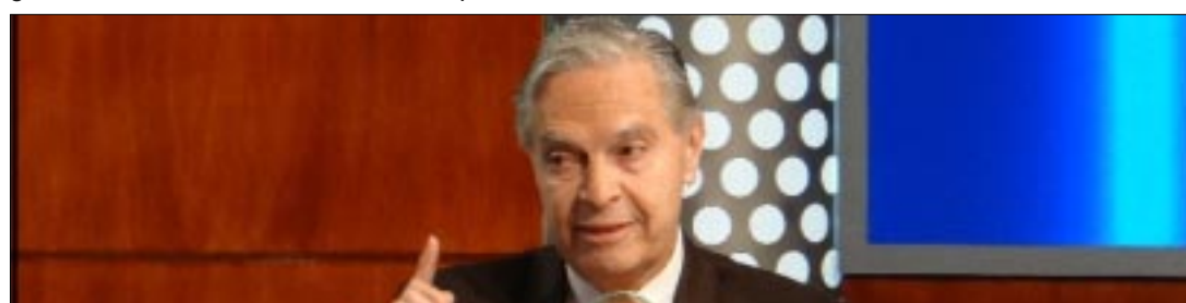
CIUDAD DE MEXICO.-Luis Ernesto Derbez asegura que la ley debe aplicarse a todos; confirma que ya hace recorridos por el país para anunciar sus propuestas; sólo iría por el albiazul.

ganar en 2018; además aclaró que sólo buscaría ser candidato del PAN.