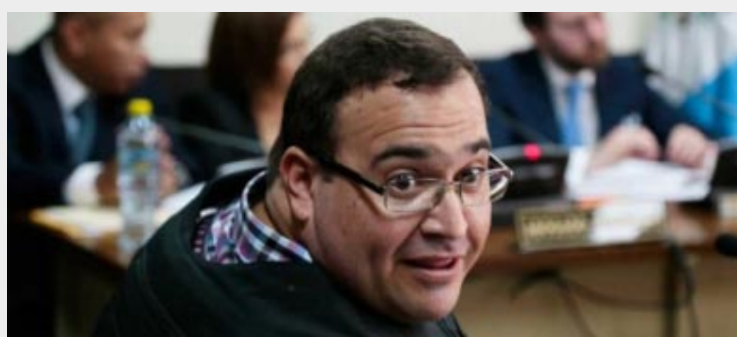
CIUDAD DE MEXICO.-El exmandatario de Veracruz fue trasladado del penal de Matamoros, en Guatemala, al Inacif para ser valorado por médicos; juez autorizó que saliera de la prisión para revisión.

Durante la concentración también se exigieron garantías para la realización de su trabajo en todo el país, así como el esclarecimiento de los crímenes contra el gremio. Diversos representantes de los comunicadores tomaron el micrófono para señalar que el asesinato del periodista sinaloense, fundador del semanario RíoDoce en Culiacán, a unos pasos de su oficina, no puede quedar impune. Sobre la entrada principal de Gobernación, en Abraham González 48, se colocó una bandera monumental, con la que simbólicamente se clausuró la dependencia.