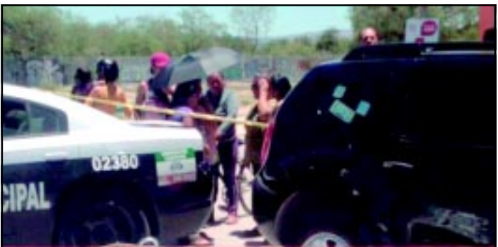
La pequeña fue arrollada y muerta el Día del Niño en el Fraccionamiento Misión del Palmar.