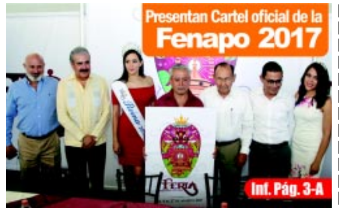
Presentan Cartel oficial de la Fenapo 2017