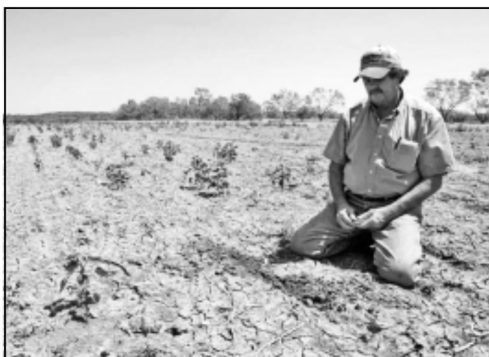
Campesinos y ganaderos afectados severamente por la sequía.

Dijo, "no se puede perder de vista que se enfrenta una situación complicada y difícil en el campo por falta de lluvia y esto sigue representando un riesgo sobre todo en el sector de la ganadería que no deja de ser todavía preocupante". Sostuvo que se han destinado a través de diversos programas institucionales no están respondiendo de acuerdo a la necesidad que demanda este sector porque se enfrenta una situación muy compleja.