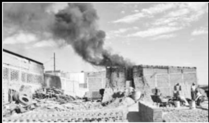
Vecinos de la zona norte son quienes sufren las consecuencias de la contaminación que generan las ladrilleras.

El legislador expuso que hay hornos ecológicos que cumplen todas las normas ambientales y son los que deben estar en funcionamiento, "quienes se dedican a esta actividad deben invertir, deben ser conscientes del grave daño que causan al medio ambiente y a la salud de las personas, incluyendo a sus seres cercanos".