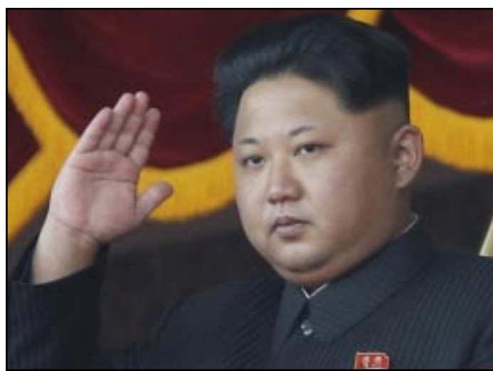
PIONYANG.- Corea del Norte aseguró que está preparada para enfrentarse bélicamente a EU y se vanaglorió del arsenal termonuclear que asegura poseer; también aseguró que Pyongyang seguirá con sus pruebas de misiles.

USS Carl Vinson navegar rumbo a las aguas de la península coreana, en respuesta a la creciente tensión por las pruebas nucleares y de misiles de Corea del Norte. El vicepresidente de Estados Unidos, Mike Pence, anunció la víspera que el portaviones llegaría "dentro de unos días" al mar de Japón, pero sin precisar dónde está ahora. El USS Carl Vinson cuenta con casi 70 aeronaves, incluidos 24 cazabombarderos F/A-18, 10 aviones cisternas, 10 aviones antisubmarinos S-3A, seis helicópteros antisubmarinos SH-3H, cuatro aviones de guerra electrónica EA-6B y cuatro aviones de alerta temprana E-2.