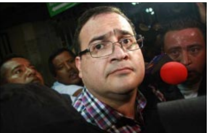
GUATEMALA.- La defensa del exgobernador de Veracruz espera la sea oficializada la petición de extradición.

Esto no quiere decir que no lo vaya a hacer (aceptar la extradición a México para ser juzgado), sino que me reservo ese derecho hasta que llegue la solicitud formal", insistió.