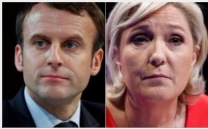
PARÍS.- Los resultados a boca de urna, ubican a ambos candidatos en la segunda vuelta del 7 de mayo. Se esperan los primeros resultados oficiales.

De igual forma apuntó que el "candidato Macron no se diferencia mucho de las políticas del presidente ahora saliente François Hollande".