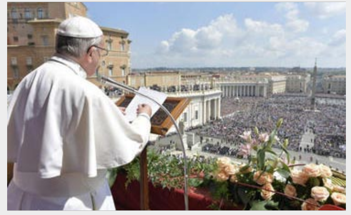
CIUDAD DEL VATICANO.- El Papa imploró la paz en Oriente Medio y en Siria, donde reinan "horror y muerte", en su tradicional bendición "Urbi et Orbi" del Domingo de Pascua.

Pero también para que se conceda la paz «a todo el Oriente Medio, especialmente a Tierra Santa, como también a Iraq y a Yemen» y recordó «Sudán del Sur, Somalia y la República Democrática del Congo, que padecen conflictos sin fin, agravados por la terrible carestía que está castigando algunas regiones de África».