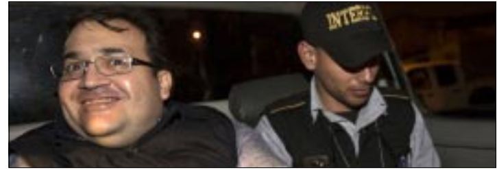
CIUDAD DE MEXICO.- En el sistema de Interpol ahora sólo se aprecia la ficha de búsqueda de César Duarte Jáquez, ex gobernador de Chihuahua.

del ex mandatario este sábado en Panajachel, Guatemala.