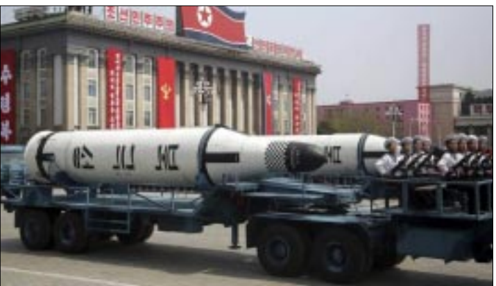
SEUL.-El vicepresidente Mike Pence, dijo ante un grupo de militares estadounidenses, "La provocación de esta mañana del Norte es simplemente el último recordatorio de los riesgos que encara cada uno de vosotros cada día"

El vicepresidente afirmó durante la cena que «el compromiso con esta alianza histórica» es más ahora fuerte que nunca. El número dos de la Administración Trump se reunirá mañana con el presidente surcoreano en funciones, Hwang Kyo-ahn, y con el presidente de la Asamblea Nacional (Parlamento), Chung Sye-kyun.