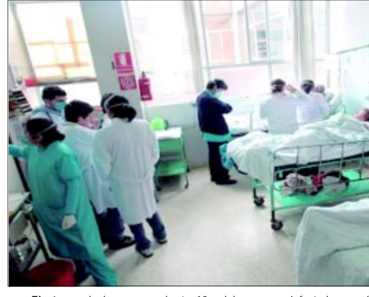
El número de decesos, se elevó a 13 y el de personas infectadas por el virus es de 280, dio a conocer la Secretaría de Salud.

privada, se estima que en Semana Santa las expectativas de ocupación hotelera y afluencia turística se vean rebasadas, por lo que solicitó el compromiso de los prestadores de servicios y de la ciudadanía para brindar una buena atención al visitante. Finalmente, el Consejo Empresarial Mexicano de Comercio Exterior lanzó la convocatoria para el Premio de Calidad de Exportación.