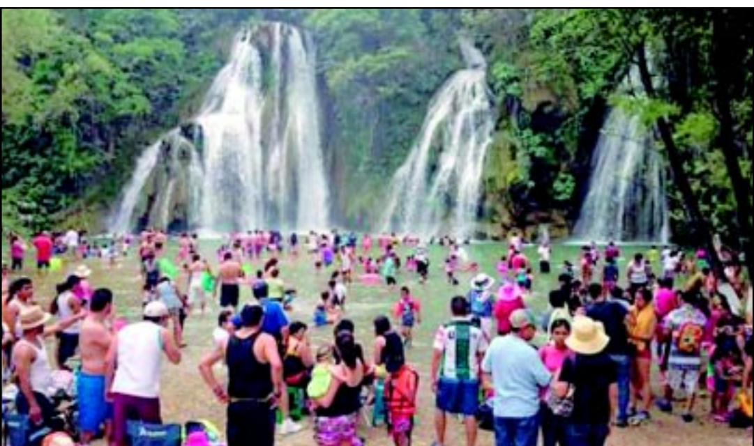
Miles de visitantes se hacen presentes tanto en la capital, como en la Zona Media, pero principalmente la Huasteca, donde incluso han tenido que adaptarse conventos como hospedajes.

En lo que respecta a la capital, con motivo de la Procesión del Silencio, los hoteles reportan una ocupación cercana al cien por ciento y se indicó que más de 90 mil personas presenciaron el más importante evento religioso potosino, durante la Semana Santa