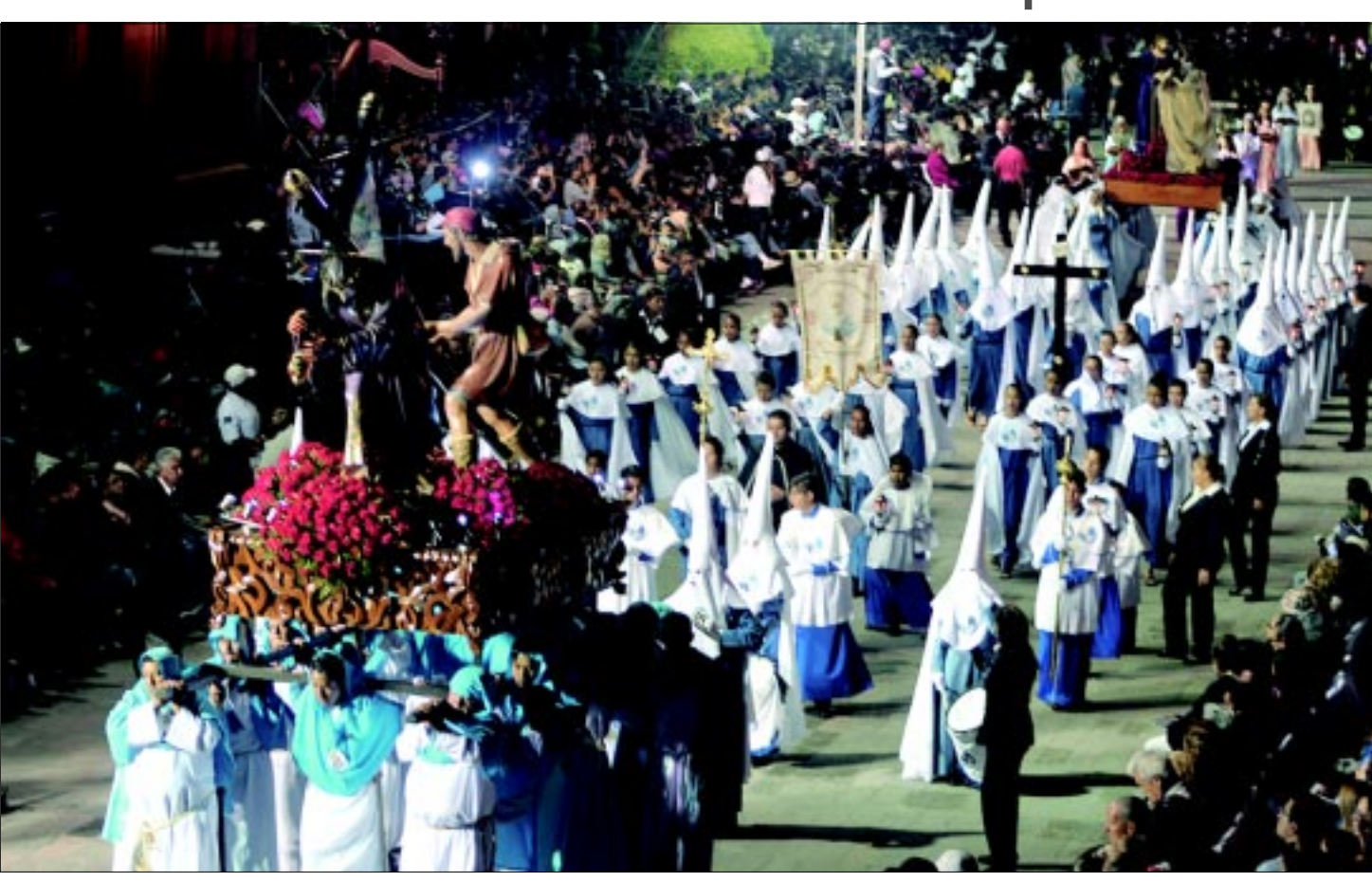
Miles de espectadores potosinos y visitantes, presenciaron ayer con profundo respeto, dolor y llanto el paso de la Procción del Silencio que recuerda la muerte de Jesús y el sufrimiento de una madre que perdió a su hijo que dio su vida por la humanidad. (Vea más gráficas en la Página 3-A)

Una multitud presenció la marcha silenciosa Ofrecieron su pésame a la Virgen María