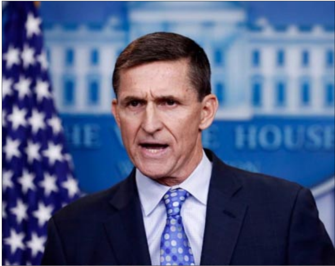
WASHINGTON. - Michael Flynn fue advertido de no recibir dinero de otros países sin la aprobación del Pentágono, y el ex asesor de seguridad nacional es investigado sobre su relación con Rusia.

Flynn ganó decenas de miles de dólares de la red de televisión RT patrocinada por el gobierno ruso y de un empresario turco vinculado con el