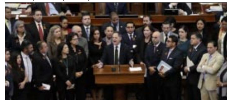
AUSTIN. - Fue avalada con 95 votos a favor y 54 en contra; los jefes policiales y otros funcionarios podrán enfrentar cargos y serán despedidos por no aplicar la ley migratoria.

local ayude a las autoridades federales como parte de una campaña mayor para reprimir a los presuntos delincuentes que se encuentran en el país de manera irregular. El proyecto original de la cámara baja permitía a los agentes de la ley averiguar sobre el estatus migratorio de una persona solamente si era arrestada.