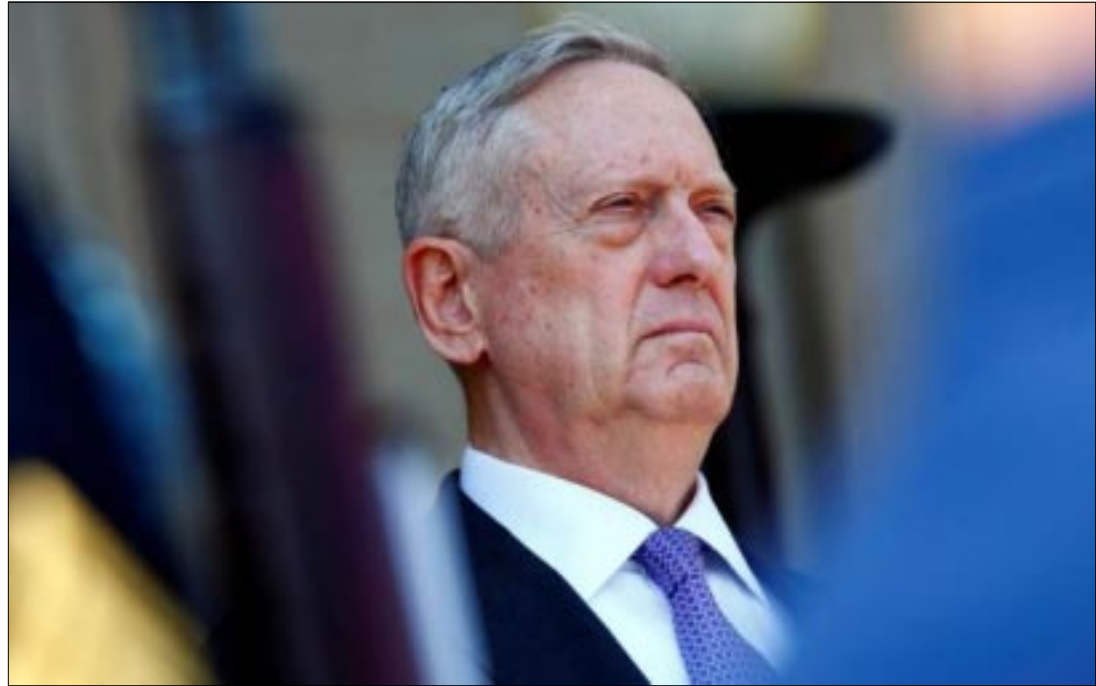
ARABIA SAUDÍ.- El secretario de Defensa de EU, Jim Mattis, señaló que Kim Jong-un trató otra vez "de provocar algo con el lanzamiento de un misil", el cual no identificó, pero aseguró que no se trataba del tipo intercontinental.

el funcionario. La alianza militar con Arabia Saudí, que data desde 1944 y que depende en gran medida de la riqueza petrolera de la monarquía, ha convertido a Washington en el surtidor de armas más importante de la monarquía.