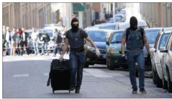
FRANCIA.- La policía arresta a dos ciudadanos franceses 'radicalizados' que planeaban un 'ataque inminente y violento' en los próximos días.

La líder de extrema derecha Marine Le Pen, una de las favoritas, tiene programado realizar un gran mitin final en Marsella esta semana, según su programa.