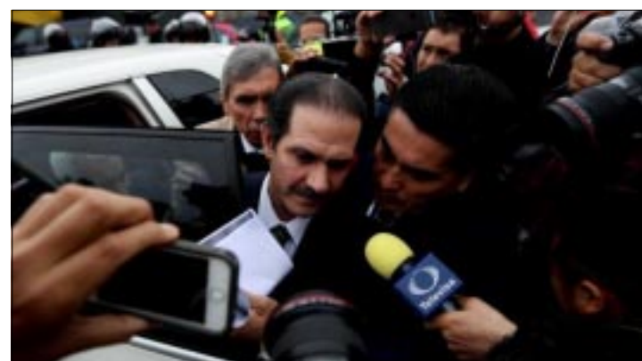
CIUDAD DE MÉXICO.-El Juez Segundo de Distrito en el estado de Sonora consideró inconstitucional la creación de la Fiscalía estatal Anticorrupción.