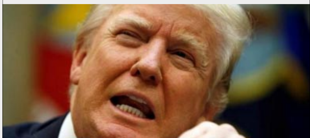
NUEVA YORK.-El presidente de EU, Donald Trump, propuso una rebaja presupuestaria del 28% para diplomacia y ayuda exterior, incluyendo una reducción no específica en el apoyo financiero a la ONU y sus agencias.

so de Estados Unidos. «La retirada y el unilateralismo de Estados Unidos, o incluso la percepción de ello que tienen otros actores, crearía el riesgo de volver a las viejas esferas de influencia política, y la historia nos enseña que eso solo generó más inestabilidad», comentó Delattre. «En política exterior, al igual que en política, las percepciones importan», agregó. El presidente de Estados Unidos, Donald Trump, propuso una rebaja presupuestaria del 28 por ciento para diplomacia y ayuda exterior.