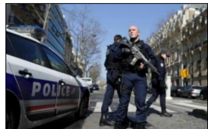
PARIS.-Una mujer resultó lesionada por la explosión en la sede del Fondo Monetario Internacional en el centro de París; la fiscalía antiterrorista abrió una investigación por intento de asesinato.

que el gobierno «hará frente a la situación» e insistió en que «es pronto para sacar conclusiones». El ministro no pudo confirmar, no obstante, la relación entre este explosivo y el envío del paquete con explosivos detectado ayer en el ministerio de Finanzas de Alemania, a cuyo titular, Wolfgang Schäuble, iba dirigido y del que se responsabilizó la organización terrorista griega Conspiración de los Núcleos del Fuego.