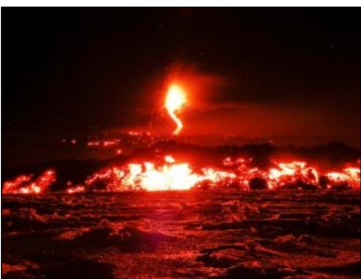
ROMA.- Los heridos leves son en su mayoría turistas que se encontraban visitando uno de los cráteres de la ladera del volcán.

culo en días recientes, pero hasta ahora no ha causado molestias a la población cercana. El aeropuerto de Catania sigue abierto y ha habido erupciones de cenizas volcánicas pero solo periódicamente. La explosión se produjo al entrar en contacto la lava con un bloque de nieve que taponaba el cráter y los turistas fueron heridos principalmente por las lascas de piedra que saltaron por los aires. Hace dos días en los que el volcán entró en una nueva fase de erupción, una actividad que está siendo controlada por el Instituto Nacional de Geofísica y Vulcanología (INGV). Este organismo difundió imágenes en las que se aprecian las explosiones de lava y de ceniza en un cráter de la ladera sudeste del volcán, que alcanzan los 200 metros de altura. El Etna, que con sus 3.322 metros de altura es el más activo de Europa, se encuentra situado en la parte oriental de la isla de Sicilia, entre las provincias de Mesina y Catania, y su última erupción se registró el pasado 28 de febrero.