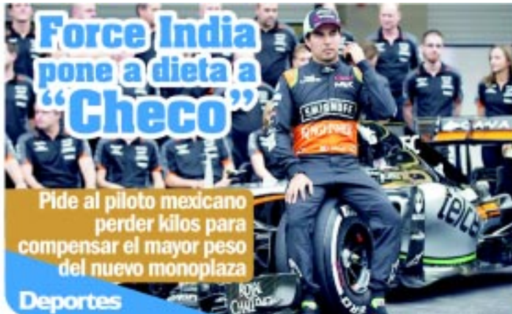
Force India pone a dieta a "Checo". Pide al piloto mexicano perder kilos para compensar el mayor peso del nuevo monoplaza