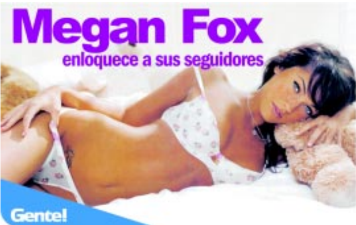
Megan Fox enloquece a sus seguidores