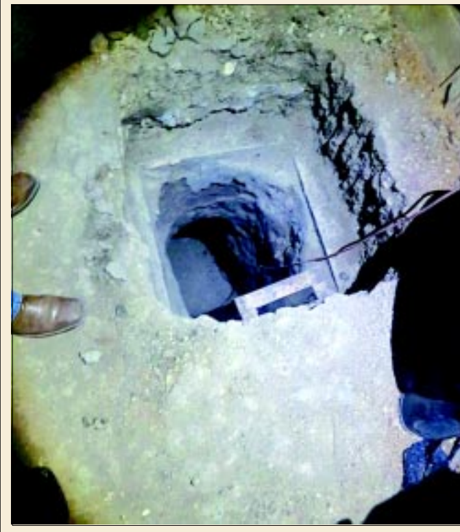
Al estilo «Chapo» Guzmán, 29 reos se fugaron del penal de Ciudad Victoria por un túnel; fueron recapturados 12 y siguen prófugos 12. Se teme que algunos hayan ingresado a territorio potosino.

Ante la posibilidad de que varios de los reos que se fugaron del penal de Ciudad Victoria pudieran encontrarse escondidos en territorio potosino, las autoridades policíacas estatales realizan investigaciones tendientes a su localización. De acuerdo a versiones extraoficiales y dentro de la coordinación policíaca que existe entre las autoridades de San Luis Potosí y Tamaulipas, se trabaja en coordinación para tratar de recapturar a los presos evadidos, de encontrarse en esta entidad. Lo anterior fue confirmado por la vocería de Seguridad Pública de Tamaulipas, quien señaló que se solicitó la colaboración de policías Nuevo León, Veracruz y San Luis Potosí, así como al Grupo Coordinación Tamaulipas para búsqueda y recaptura de los reos que se fugaron del