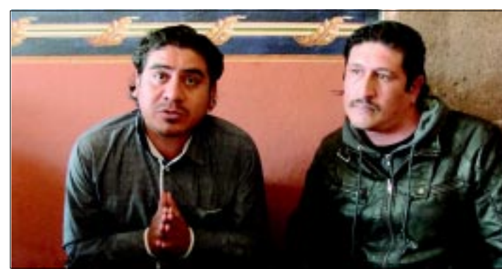
Padres de familia e integrantes de Vecinos Unidos, denunciaron que en días pasados una mujer entró a la primaria Barros Sierra, y pretendió llevarse a una alumna, pero la menor pudo evitar ser víctima