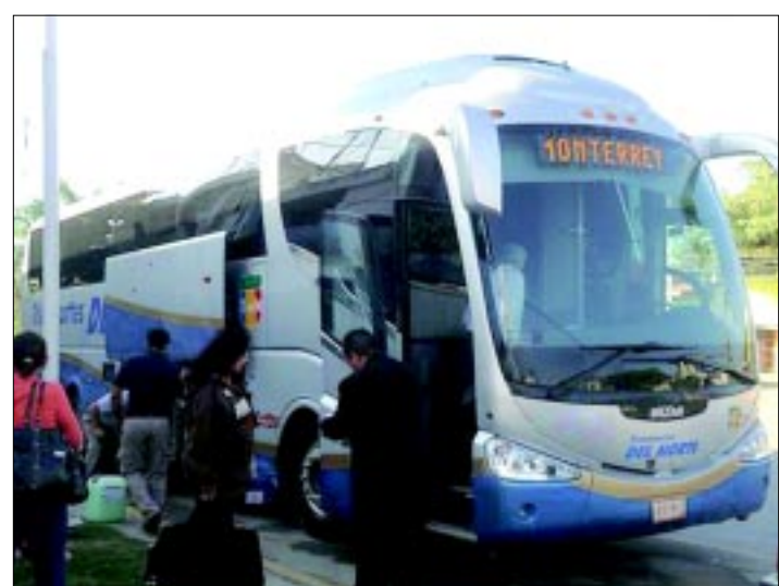
La PGJE investiga el atraco perpetrado por dos sujetos que viajaban en un autobús y despojaron de sus pertenencias a punta de pistola a pasajeros, a la altura de El Huizache.

Asimismo, se cuenta con las características físicas de los dos hombres y la vestimenta que traían cuando cometieron el ilícito.