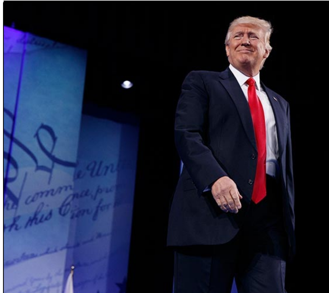
WASHINGTON.-A través de su cuenta de Twitter el presidente de EU atacó al país asiático y recaló que China no ha hecho nada para frenar el régimen norcoreano.

Está previsto que parte de esas reuniones se centren en preparar el próximo viaje de Xi a EU para reunirse con Trump, quien va a recibirlo en abril en su lujoso club de Mar-a-Lago (Florida).