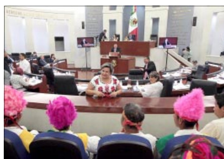
El Pleno del Congreso, aprobó por unanimidad la declaratoria de la ceremonia como Patrimonio Cultural Intangible del Estado.