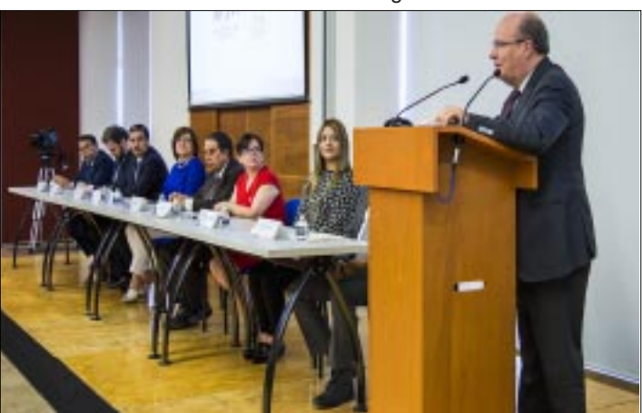
El Parlamento de los Niños y Las Niñas 2017, sesionará el 7 de julio, en el salón "Ponciano Arriaga Leija" del Congreso del Estado.

Quiénes integren el Parlamento de las Niñas y los Niños, Año 2017, se expresarán libremente como integrantes del mismo, y sus manifestaciones verdaderas durante sus trabajos, deberán ser tomadas en cuenta por los integrantes de la Sexagésima Primera Legislatura, por tratarse de una experiencia de participación democrática con el fin de favorecer la promoción, defensa y el ejercicio pleno de los derechos de las niñas y niños, finalizó el legislador.