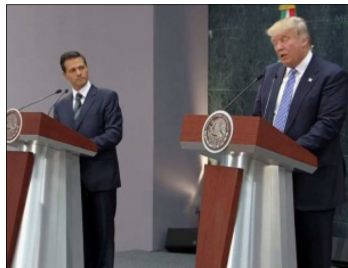
CIUDAD DE MEXICO.- Peña Nieto es un gran hombre», declaró en conferencia de prensa.

En una conferencia de prensa, Trump citó como ejemplo de esas filtraciones su llamada telefónica de finales de enero con el presidente mexicano, Enrique Peña Nieto, y dijo que no le importa demasiado que se revele su contenido porque «no era tan importante», pero le preocupa que se filtren