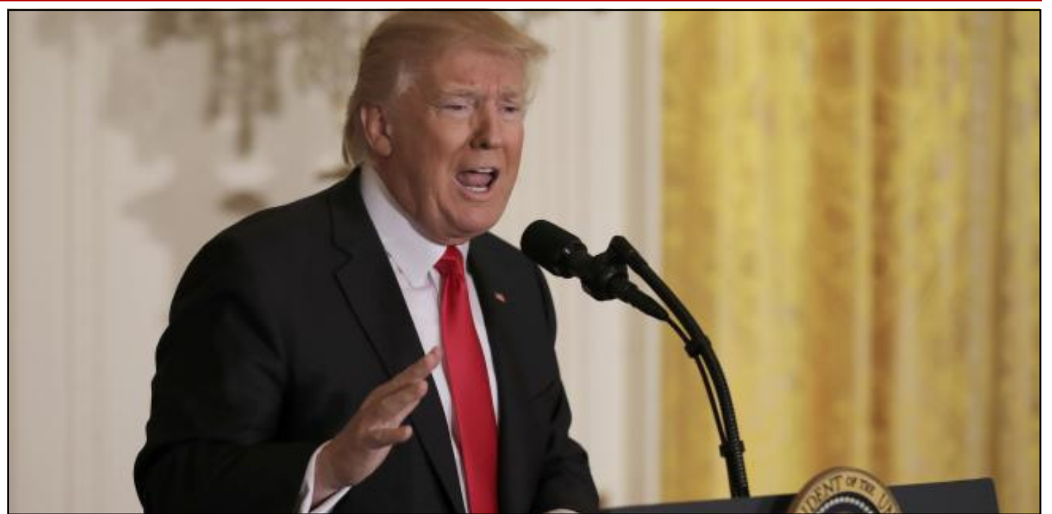
CIUDAD DE MEXICO.- Donald Trump, dijo hoy que ha pedido al Departamento de Justicia que investigue las filtraciones «criminales».

Este no es el primer año que la Auditoría critica el programa. Según este análisis la Sedesol no ha mejorado la coordinación de los programas incluidos en la estrategia y mucho menos ha logrado erradicar la pobreza alimentaria.