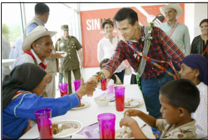
CIUDAD DE MEXICO.- Los problemas más graves que encontró la Auditoría Superior de la Federación en el gasto público de 2015 fue el abuso de contrataciones millonarias sin licitación pública y el desvío de recursos.

Millones de pesos desviaron dependencias