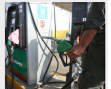
CIUDAD DE MEXICO.- José Antonio Meade asegura que se está revisando si hay o no aumento al combustible.

un poco el aumento y creo que va a ser el caso para los siguientes días. Vamos a ver ajustes, pero van a ser muy menores".