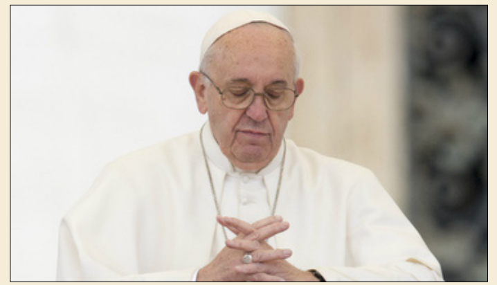
VATICANO.- Añade que "Dios le pedirá cuentas" a todos, incluso a quienes piensan que están en paz.