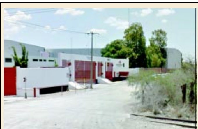
El diputado no ha renovado permisos de PC, para que camiones de su empresa, puedan transportar material de peligrosidad, revela Félix Herrera Ortega.

aviso a las autoridades competentes y se presentaron agentes federales a iniciar las investigaciones del caso. Se espera estén en condiciones de declarar los lesionados, para conocer su versión de los hechos. Los daños materiales fueron estimados en varios miles de pesos.