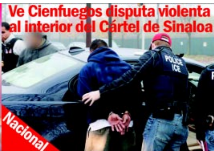
Ve Cienfuegos disputa violenta al interior del Cártel de Sinaloa