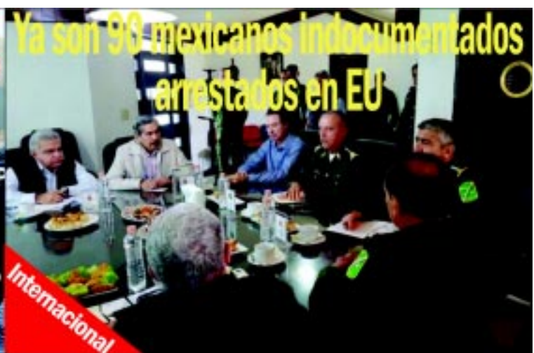
Ya son 90 mexicanos indocumentados arrestados en EU