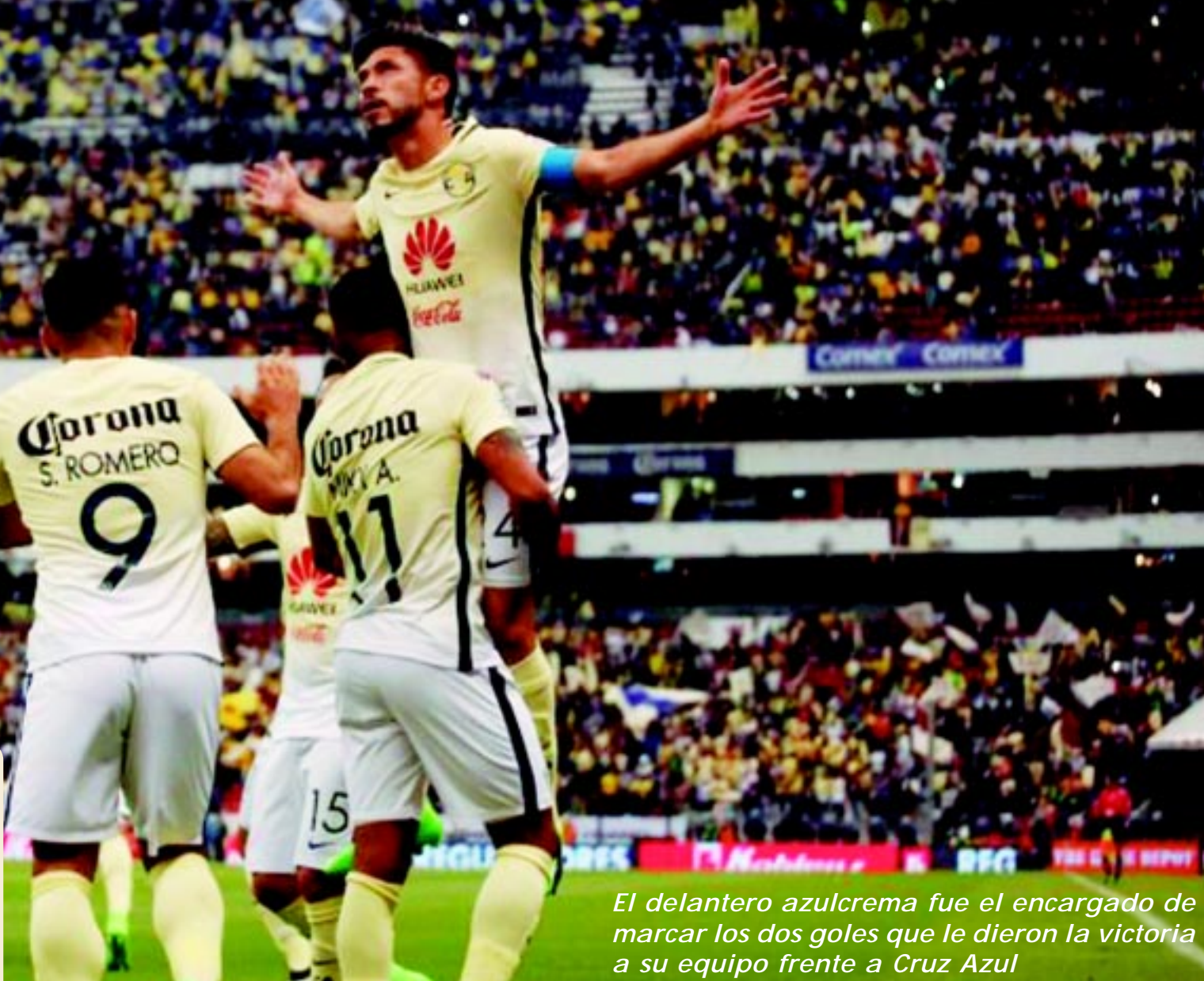
El delantero azulcrema fue el encargado de marcar los dos goles que le dieron la victoria a su equipo frente a Cruz Azul

Con este resultado, el cuadro de Coapa escala hasta la décima posición, al sumar 10 unidades, mientras que Cruz Azul se hunde en la tabla general, al permanecer con tan sólo seis puntos en el presente Clausura 2017.