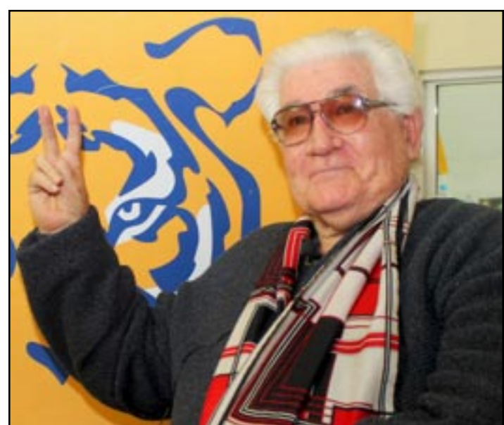
Don Carlos falleció el día en que Tigres y Morelia se topaban en la Jornada 8 del Clausura 2017 en el Volcán.

"Ya después de unos cuatro años de que estaba en Morelia, me invita Irapuato a una gira por el Oriente, nos tocó ir a Tokio, a China, Hun-