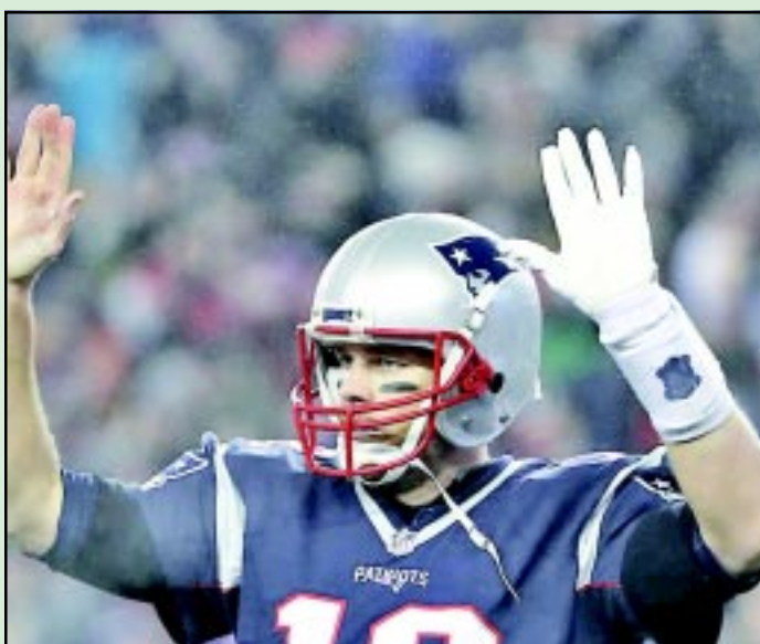
El Gobernador poblano invitó a la directiva a trabajar para evitar un posible descenso.

Además el Gobernador poblano invitó a la directiva a trabajar para evitar un posible descenso.