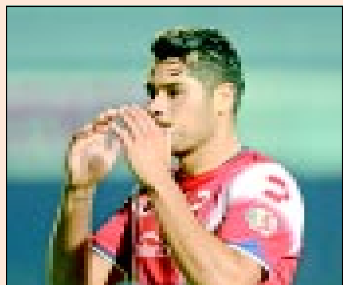
Orozco aseguró que el próximo viernes ante Chiapas será un partido muy complicado, pero considera que los escualos llegarán en buen nivel.

El atacante de los Tiburones Rojos de Veracruz admitió que, hoy en día, los contactos en el fútbol se han vuelto más peligrosos, esto derivado de lo sucedido con algunos jugadores, por lo que le gustaría que los futbolistas recibieran capacitación para saber reaccionar ante estos casos.