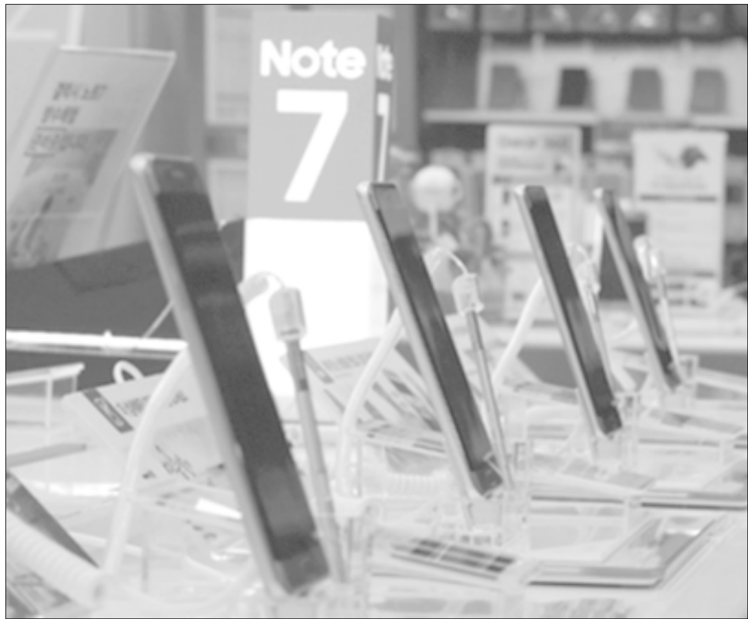
Señalan que la empresa dará a conocer resultados de la investigación en el modelo Note 7.

El grupo surcoreano retiró a principios de setiembre unos 2.5 millones de ejemplares de Galaxy Note 7 de diez mercados cuando surgieron las quejas de que las baterías de litio explotaban durante la recarga. Luego tuvo que extender la medida cuando aparecieron nuevos informes sobre que los teléfonos de reemplazo se incendiaban.