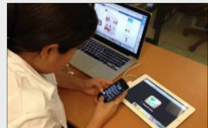
Estos grupos, a los que se accede sólo con invitación, suelen organizar ataques o cyberbullying en contra de otros usuarios.

den parecer hasta décadas después de realizarse el tatuaje, provocando la aparición de patologías autoinmunes subyacentes. "Asimismo, los trastornos de la pigmentación de la piel se pueden dar en el 5 o el 15 por ciento de las personas que se someten a una terapia láser para eliminar el tatuaje", recalca el informe. Por todo ello, la Comisión Europea ha destacado la necesidad de actualizar los requisitos químicos y el etiquetado de los componentes que se usan en los tatuajes, así como analizar los riesgos que pueden suponer para la salud. Además, ha aconsejado no usar aquellos que contienen aminas aromáticas. Precisamente, este verano la Academia Española de Dermatología y Venerología (AEDV) recomendó elegir colores azules, grises y negros a la hora de hacerse un tatuaje.