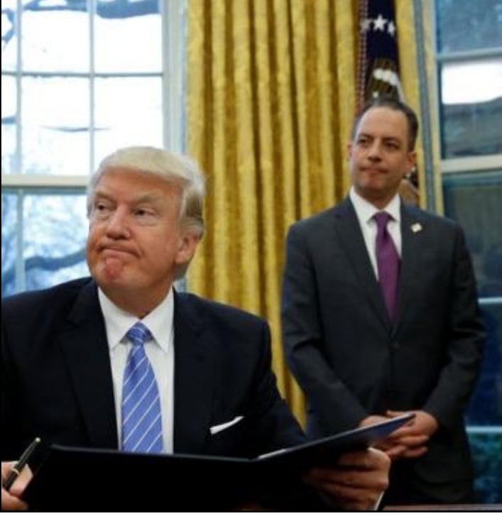
WASHINGTON.- El presidente estadounidense firma un decreto para retirar a su país del Acuerdo Estratégico Transpacífico de Asociación Económica.

Expertos en el tema afirman que era poco probable que la