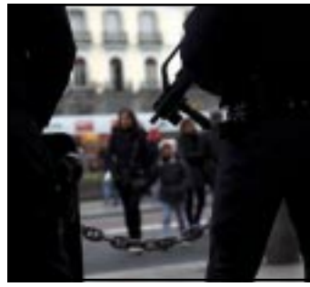
MADRID.- La Guardia Civil arresta a una mujer originaria de Monterrey convertida al islam; es acusada de enaltecimiento del terrorismo.

El Ministerio del Interior dijo que España ha detenido a 183 personas acusadas de mantener lazos con el terrorismo yihadista desde mediados de 2015, cuando el nivel de alerta antiterrorista se elevó a raíz de atentados en Túnez, Francia y Qatar.