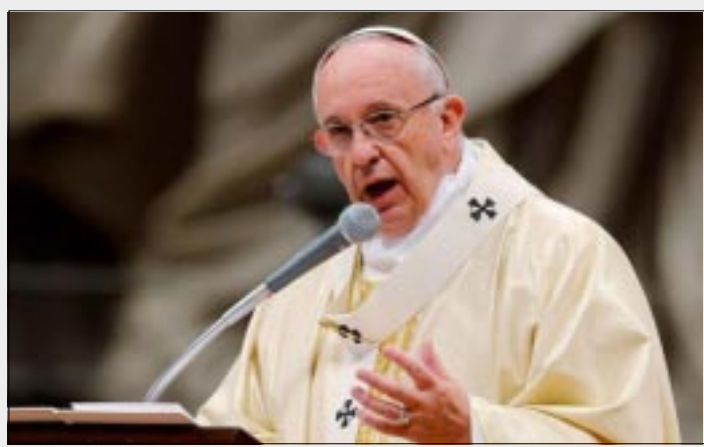
EL VATICANO.- El Papa advirtió hoy que el dinero producto de los negocios "sucios" está manchado con sangre e imploró a Dios que toque el corazón de los mafiosos para que "se conviertan y cambien de vida".

El dinero de los negocios sucios y los delitos mafiosos es dinero ensangrentado.