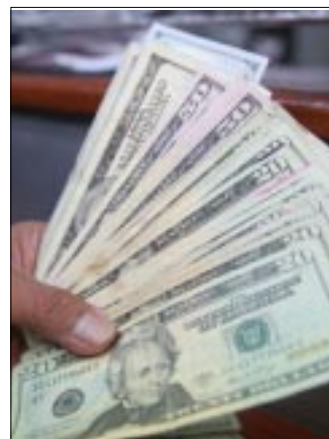
CIUDAD DE MEXICO.- La moneda extranjera se ofrece en un máximo de 21.98 pesos y se adquiere en un mínimo de 20.99 pesos.

Por su parte, el euro se vende hasta en 25.00 pesos y se compra en una menor cotización de 22.70 pesos.