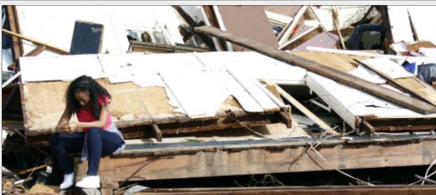
HATTIESBURG.- Bomberos y policías recorrieron puerta por puerta para rescatar a víctimas