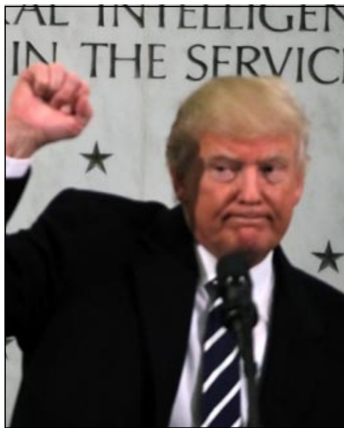
WASHINGTON.- Acusó a medios de mentir sobre cifras de asistencia a su investidura; asegura que entre un millón y 1.5 millones de personas asistieron al evento.

Durante su comparecencia en la CIA, Trump no hizo ninguna referencia a la multitudinaria marcha que se está celebrando en Washington, donde cientos de miles protestan en defensa de los derechos que ven amenazados por su llegada a la Casa Blanca. Nueva York y las principales ciudades de Estados Unidos también se sumaron a la denominada "Marcha de las Mujeres".