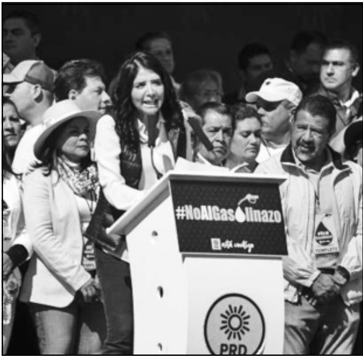
CIUDAD DEL MEXICO.- La presidenta nacional del PRD, Alejandra Barrales, pidió a los ciudadanos mantenerse alerta ante aumentos a la gasolina y advirtió que el mitin en el Monumento a la Revolución, es la primera movilización que reunió a 70 mil personas.

Al rápido mitin acudieron integrantes del Comité Ejecutivo Nacional (CEN) del PRD, como la secretaria general Beatriz Mojica, diputados, senadores y presidentes municipales.