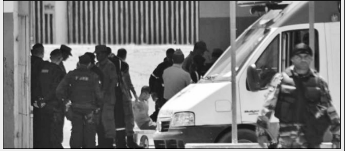
SAN PAULO.- De acuerdo con las primeras informaciones de las autoridades, una pelea entre dos facciones rivales de internos generó disturbios; el hecho ocurrió en una penal de Alcaçuz, en el noreste de Brasil.

pues existen relatos de que muchos de los muertos fueron lanzados en fosas del complejo penitenciario.