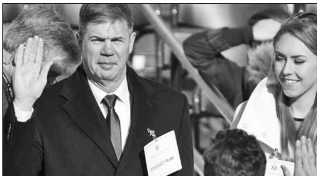
WASHINGTON.- El objetivo es practicarla secuencia de acontecimientos para que su ejecución el 20 de enero sea lo más impecable y puntual posible.

El objetivo del ensayo fue practicar las secuencias de acontecimientos para que la ceremonia verdadera del viernes salga libre de errores — y a tiempo— en cuanto se pueda.