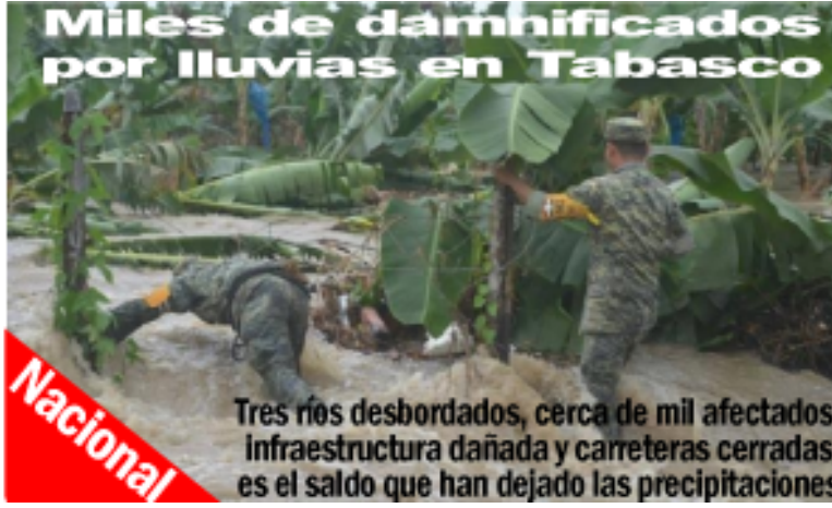
Miles de damnificados por lluvias en Tabasco