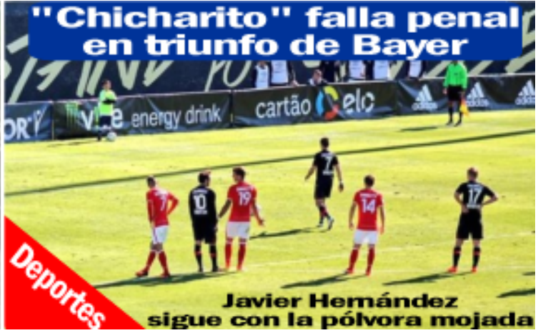
"Chicharito" falla penal en triunfo de Bayer