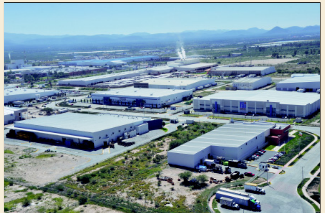
San Luis Potosí, seguirá siendo destino para inversiones globales, destaca el titular de SEDECO, Gustavo Puente Orozco.

San Luis Potosí es y seguirá siendo destino para inversiones globales, por ello se cuenta con la instalación y ampliación de 49 empresas, con una inversión de 30 mil 348 millones de pesos (1 mil 517 millones de dólares) y la generación de 15 mil 891 empleos directos, informó el secretario de Desarrollo Económico del Gobierno del Estado, Gustavo Puente Orozco.