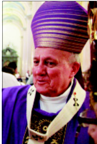
Jesús Carlos Cabrero Romero a un mayor aumento de pobreza".

El Arzobispo de San Luis Potosí, Jesús Carlos Cabrero Romero señaló que antes de haber aprobado el incremento a los combustibles se debieron llevar a cabo otras acciones como disminuir el número de diputados federales y salarios de la clase política. "Sino se pone el aumento no podría haber programas sociales, pues yo pienso que porque no hay otras medidas, que otras medidas sean por ejemplo disminuir las cámaras en los representantes, disminuir las dádivas, disminuir la corrupción, disminuir tantas justificaciones que se hacen y que bueno ahí está".