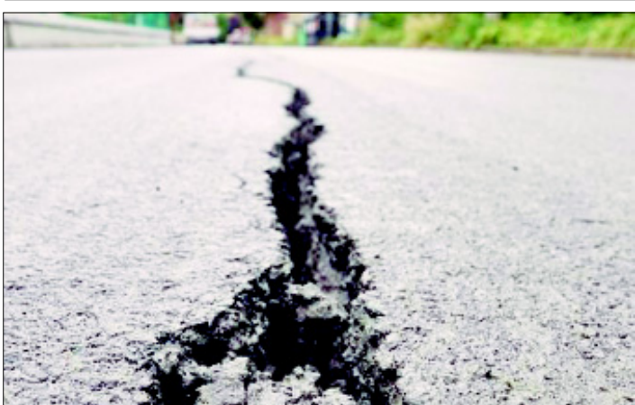
Apareció una grieta en la comunidad de Pezmayo lo que representa un grave riesgo de deslizamiento en masa, alerta Protección Civil.

inconformidades en sectores de la sociedad, no obstante, aseguró que el poder legislativo tiene que ver el beneficio de la mayoría de la sociedad; "todas las leyes son controvertidas, ya que la ley sirve para regular la conducta del hombre, para que tengamos armonía en la sociedad, pero no es fácil someternos a Derecho", acotó.