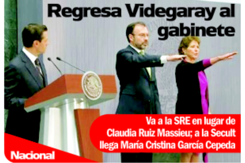
Regresa Videgaray al gabinete. Va a la SRE en lugar de Claudia Ruiz Massieu; a la Secult llega María Cristina García Cepeda