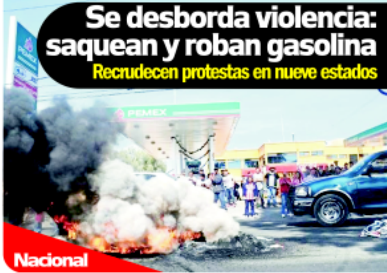
Se desborda violencia: saquean y roban gasolina. Recrudescen protestas en nueve estados