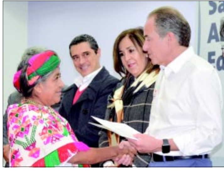
El Gobernador, Juan Manuel Carreras López, entregó constancias de alfabetización y certificados de estudios a adultos mayores.

Los elementos de la Policía Federal entregaron al muchacho a su madre y personal de la Procuraduría de Justicia del Estado de México, que se trasladaron a esta ciudad para encontrarlo sano y salvo.