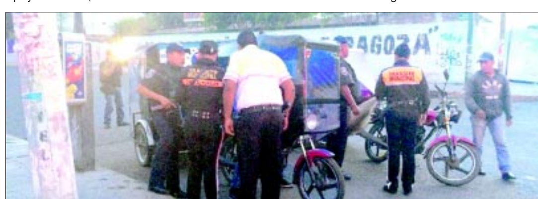
Tres sujetos se introdujeron a una vivienda a robar, pero vecinos se dieron cuenta y lo impidieron deteniendo a uno de ellos a quien querían linchar.