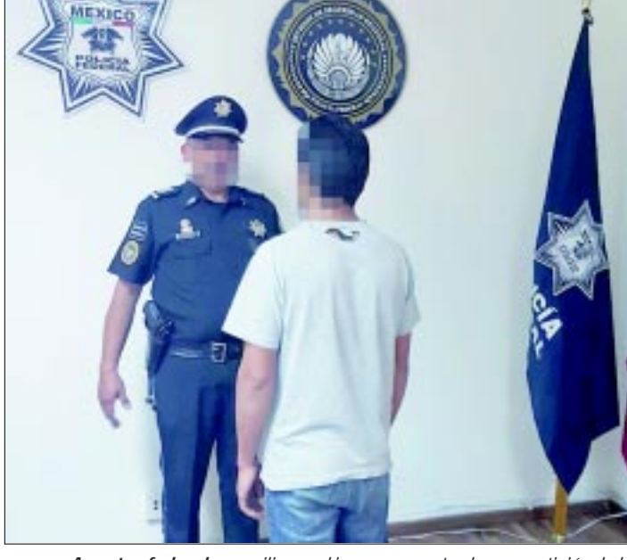
Agentes federales auxiliaron al joven secuestrado, a petición de la Procuraduría de Justicia del Estado de México.

ver las caras de los sujetos, sólo escucho una discusión y una plática en la que nunca se pusieron de acuerdo sus captores, por lo que lo abandonaron en plena calle.