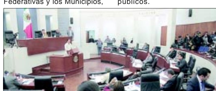
Diputados, comprometen congelar la contratación de nuevas plazas para evitar el crecimiento de la nómina

No obstante, se informó que la LXI Legislatura se mantendrá vigilante de la aplicación de los recursos por parte de la Secretaría de Finanzas del Gobierno del Estado, para transparencia y certidumbre a la ciudadanía del ejercicio responsable de los recursos públicos.