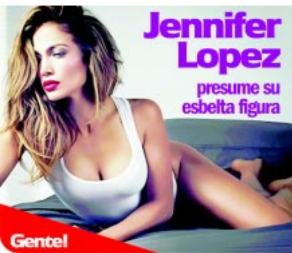
Jennifer Lopez presume su esbelta figura