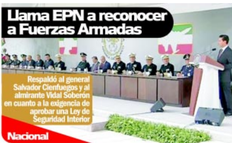
Llama EPN a reconocer a Fuerzas Armadas