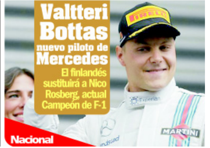
Valtteri Bottas nuevo piloto de Mercedes

El finlandés sustituirá a Nico Rosberg, actual Campeón de F-1