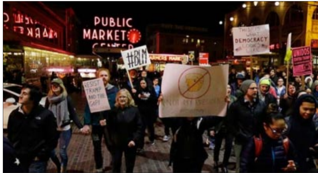
WASHINGTON.- Fiscales federales informaron que la mayoría de los 230 detenidos serán acusados por el delito grave de provocar disturbios durante la investidura del magnate.

de Washington alrededor de la hora en la que Trump rendía su juramento.