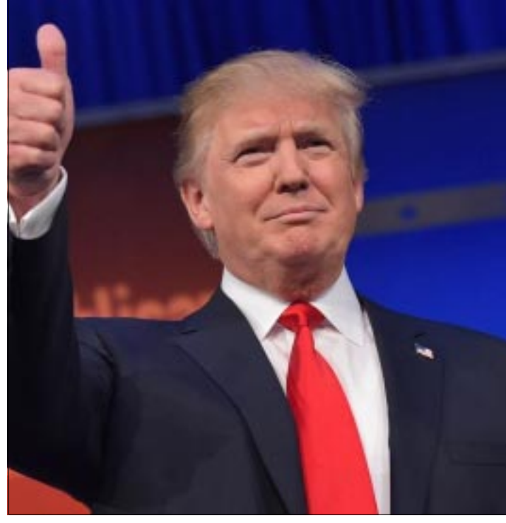
MADRID.- Los principales diarios europeos destacan la inexperiencia del nuevo presidente de EU, y consideran que su posturas son una declaración de guerra contra todo lo que representa la democracia estadounidense.

Zeitung subraya que Europa y Alemania deben entender las próximas tormentas que se avecinan ante la política que tomará la administración de Trump bajo su proyecto nacionalista.