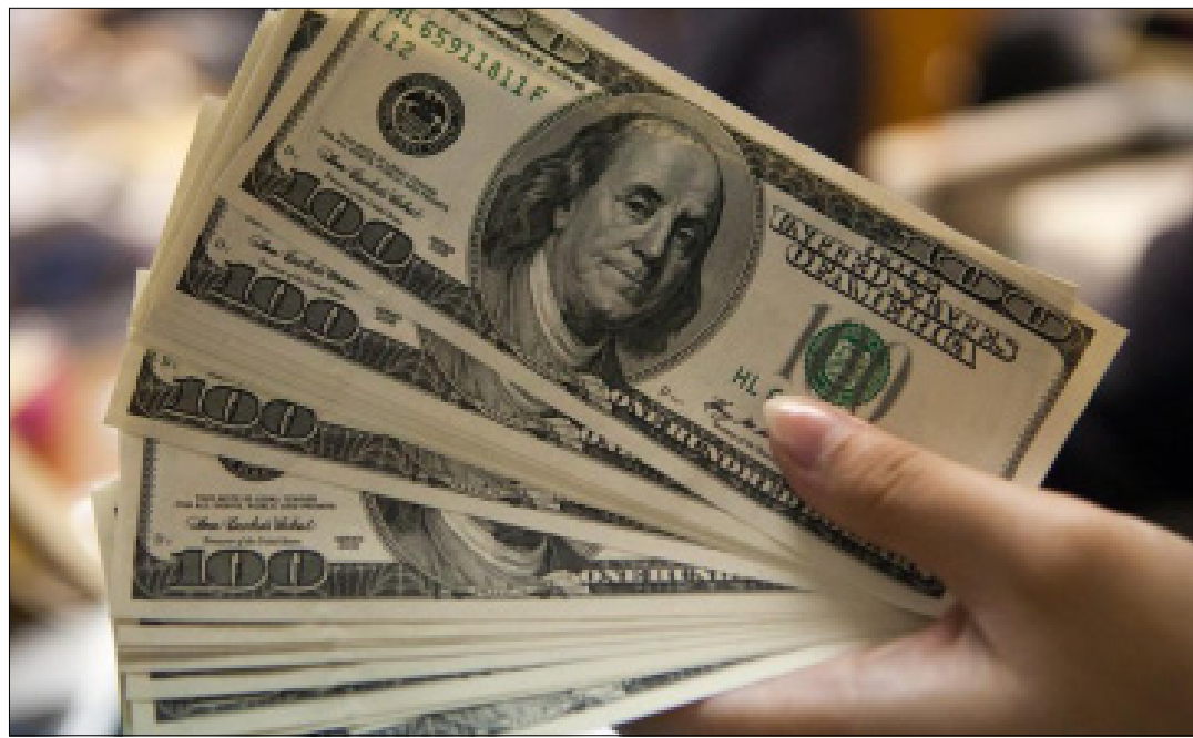
CIUDAD DE MEXICO.- La estimación máxima de venta se encuentra en 22.29, mientras que la mínima es de 21.09 pesos; el euro subió 24 centavos.

Por su parte, el gobierno de México ha sido enfático en su posición de que no pagará por el muro en la frontera con Estados Unidos.