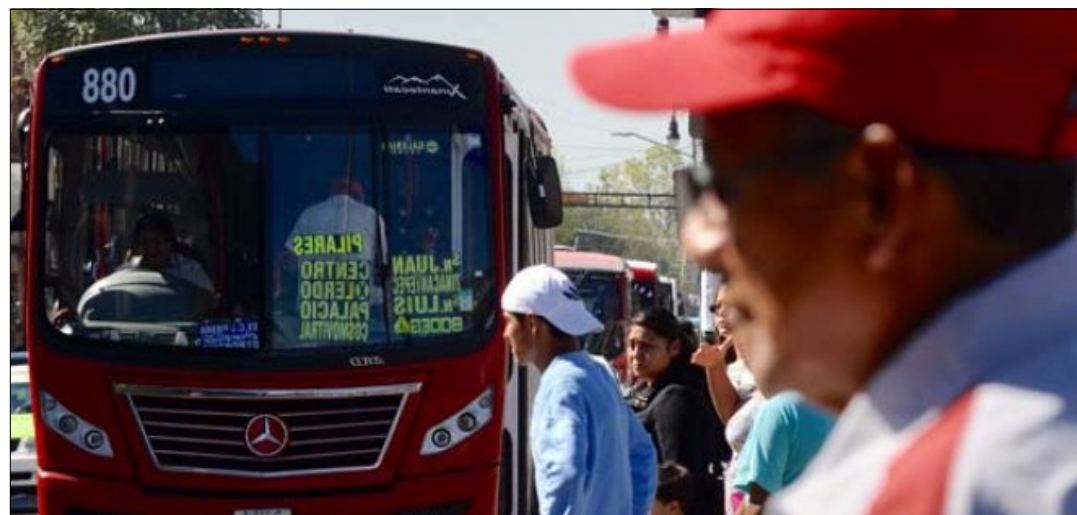
CIUDAD DE MEXICO.- Tras ajustar los precios de los traslados, solicitaron eliminar transportes ilegales y desarrollar un sistema integral.

tistas solicitaron al gobierno estatal la regulación del sector, la eliminación de los llamados taxis colectivos, así como de los irregulares, además de apoyo de sistemas integrales de mayor capacidad.