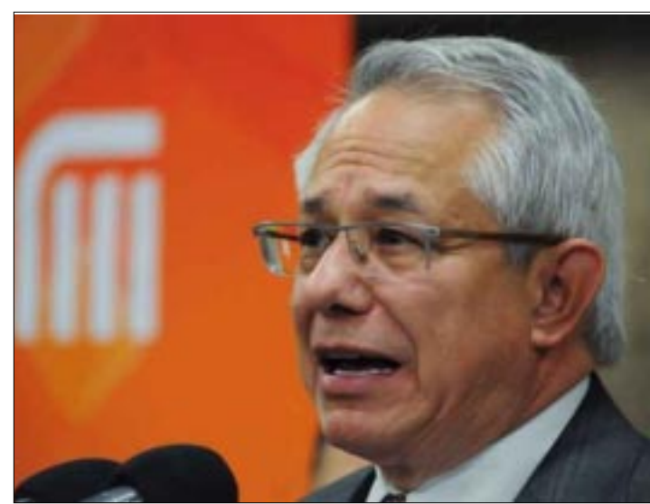
CIUDAD DE MEXICO.- Con el fin de que la fluctuación de la moneda estadounidense no afecte las finanzas del Metro, su director general aseguró que sólo se harán contratos en pesos mexicanos.

nuevas energías al metro. Se trata de empresas mexicanas y entre ellas se encuentra la Comisión Federal de Electricidad (CFE).