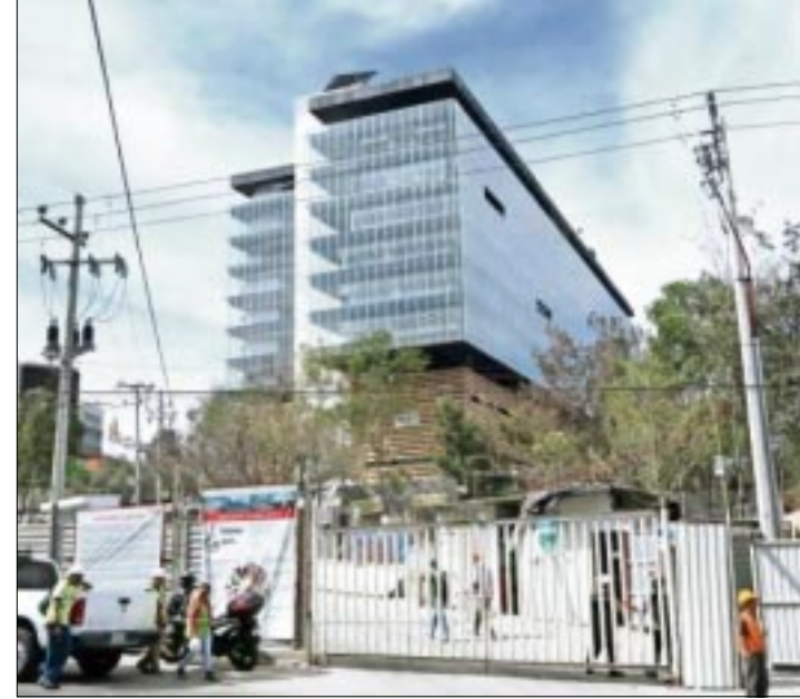
CIUDAD DE MEXICO.- El órgano anuncia ahorro de 50 mdp, equivalente a 2.2% de su presupuesto 2017; argumenta que nueva sede es para economizar gastos en reuniones y rentas.

está partida en tres", detalló. Afirmó que la comunicación, el traslado y la integralidad se complican el estar viajando para reuniones. Incluso, reveló que rentaban un edificio para 350 o 400 personas muy cerca de su sede central, en las calles de Parroquia y avenida Coyoacán, y al hacer estas adecuaciones se ahorraría este dinero del erario.