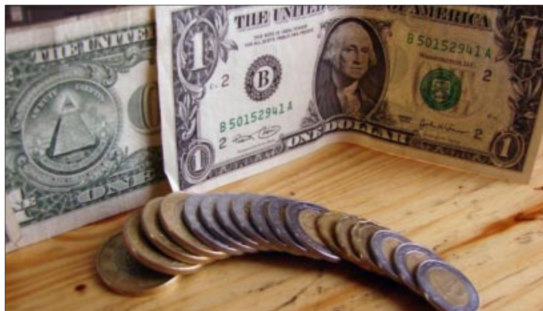
CIUDAD DE MEXICO.- La Bolsa Mexicana de Valores abrió con una ligera baja de 0.11%, a unas horas la toma de posesión de Donald Trump como presidente de Estados Unidos.

50.95 puntos menos respecto al nivel previo, en un arranque de jornada en el que las principales emisoras operan de forma mixta. En sentido opuesto, los índices de Wall Street operan con alzas, donde el Nasdaq sube 0.50 por ciento, el Standard and Poor's 500 avanza 0.45 por ciento y el promedio industrial Dow Jones gana 0.38 por ciento.