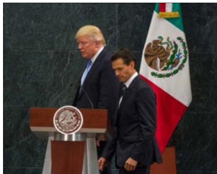
CIUDAD DE MEXICO.- Para exponer la importancia de la relación de nuestro país con el vecino del norte, basta resaltar que en 2015 la cifra por los negocios entre ambas naciones superó los 532 mil mdp.

El magnate estadounidense se considera al Tratado de Libre Comercio como "el peor acuerdo comercial" que se ha firmado en la historia de ese país, a pesar de las ventajas que la nación norteamericana obtiene del convenio.