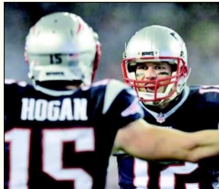
Falcons y Patriots se enfrentarán en el SB LI, en duelo que promete ser un espectáculo de pases.

Atlanta no perdió la oportunidad de humillar más a su rival y Coleman aprovechó una oportunidad para escaparse por el lado izquierdo para tres yardas y marcar otro TD para su equipo. Green Bay todavía logró otra anotación, pero ya no le alcanzó para poner en aprietos a los Falcons, dejando así la pizarra en 21-44.