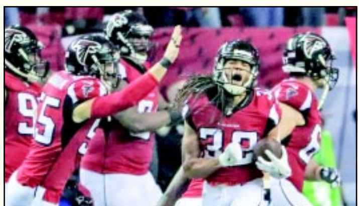
El equipo de Atlanta dejó claro que es el mejor representante de la NFC tras aplastar por 21-44 a Green Bay.

El próximo 5 de febrero los Patriots y los Falcons se enfrentarán en el NRG Stadium por la supremacía de la temporada 2016-2017 de la NFL.