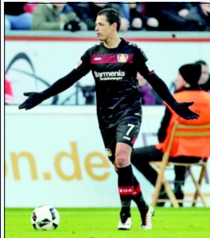
El mexicano dio la asistencia para el primer gol del Leverkusen, que se impuso al Hertha 3-1, pero sigue sin anotar en Bundesliga.

CH7 destaca en victoria del Bayer pese a sequía de goles